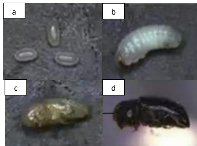
Gambar 2. (a) Telur, (b), larva,(c) Pupa, (d) imago H. hampei (Mulasari, 2016)

Kumbang penggerek buah kopi (PBKo) merupakan salah satu jenis serangga yang bermetamorfosis sempurna (Holometabola) yaitu dari telur-larva-pupa dan imago. Telurnya berbentuk elips, transparan, dan akan berubah warna menjadi kekuningan pada saat akan menetas, larva membentuk seperti huruf C, kemudian tidak bertungkai, dan bentuk dan warna kepala terlihat lebih mencolok, panjang tubuh larva kira kira 1,88- 2,30 mm, kemudian serangga ini memiliki bentuk prapupa mirip dengan larva, namun perbedaannya hanya terletak pada bentuknya yang kurang cekung, dan berwarna putih susu (Harni et al , 2015).