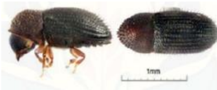
Gambar 1. Morfologi imago PBKo ( Hypothenemus hampei Ferr.)

Penggerek buah kopi merupakan salah satu hama yang sangat penting karena hama ini sangat mempengaruhi hasil panen yang akan didapatkan, PBKo mengarahkan serangan pertamanya pada kopi yang bernaungan, atau daerah yang lebih lembab . Dalam buah tua dan kering yang tertinggal setelah panen dapat ditemukan lebih dari 100 PBKo (Anonim, 2017).