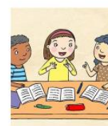
Interaksi sosial dan lingkungan