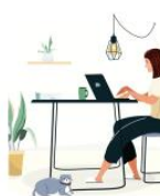
Paparan lingkungan dan kondisi kerja