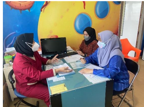
Diskusi data beban kerja di LADOKGI TNI-AL Yos Sudarso