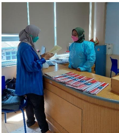
Studi pendahuluan terkait beban kerja di RSGMP Unhas