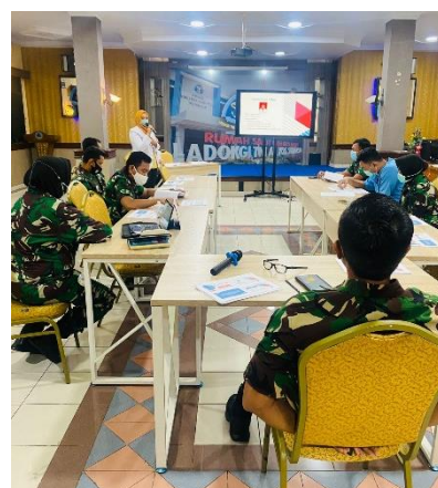
Pemaparan Hasil Penelitian di LADOKGI TNI-AL Yos Sudarso