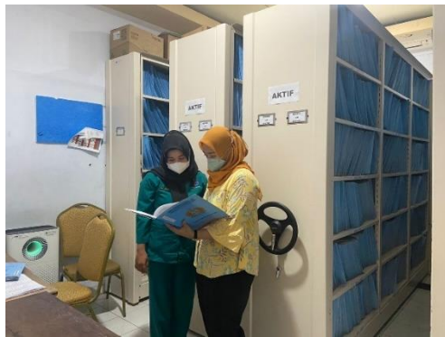
Pengambilan data medical record di LADOKGI TNI-AL Yos Sudarso