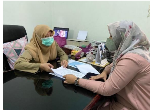
Diskusi data beban kerja di RSKDGM Pemprov Sulsel