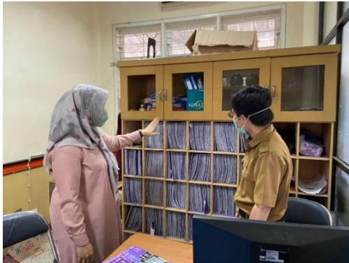
Pengambilan data medical record di RSKDGM Pemprov Sulsel