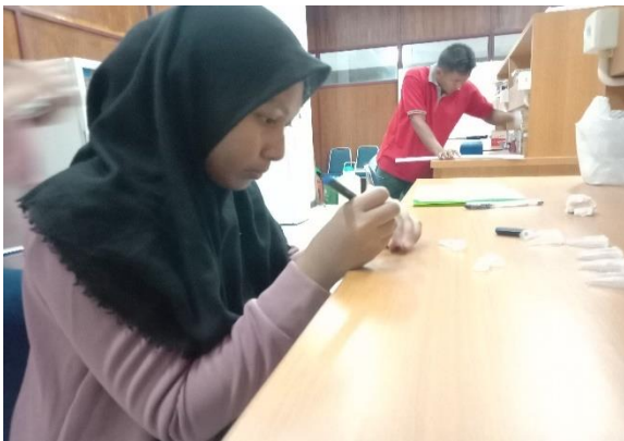
Ket: Mengoleksi Sampel Darah