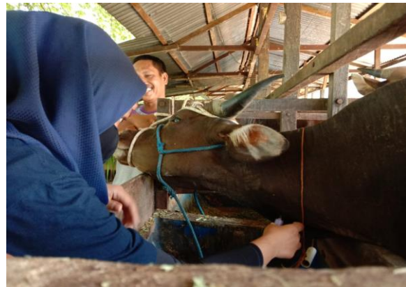
Ket: Pengambilan Darah hari Ke-0