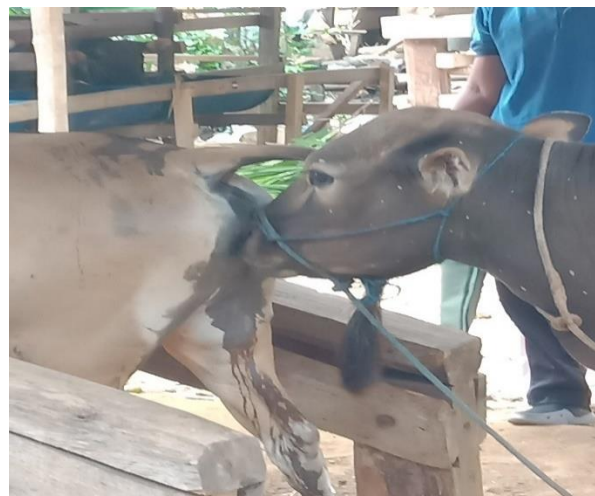
Ket: Pengamatan Pengaruh GnRH