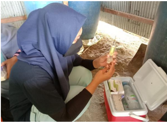
Ket: Penyuntikan Hormon GnRH