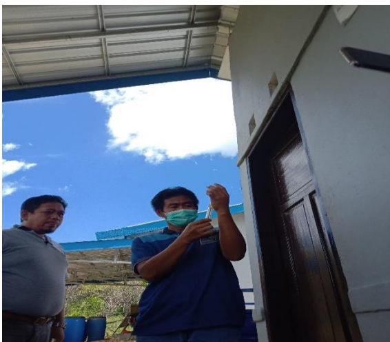
Ket: Penyuntikan GnRH hari -14