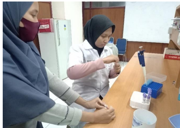
Ket: Pemisahan Plasma Darah