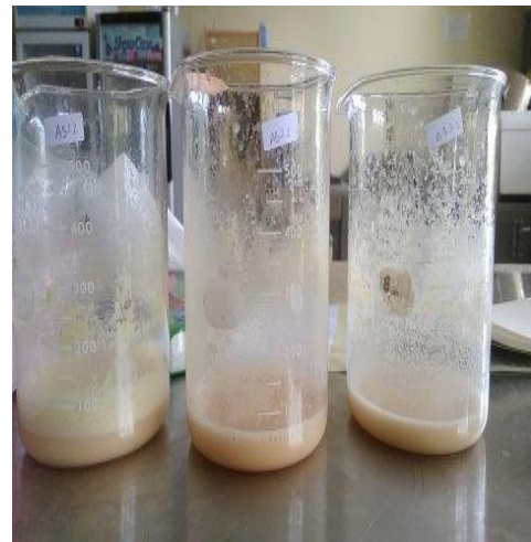
Proses pengukuran daya busa