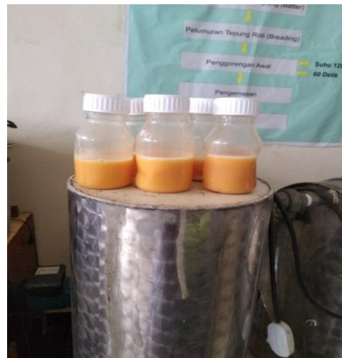
Proses Fermentasi sampel tepung