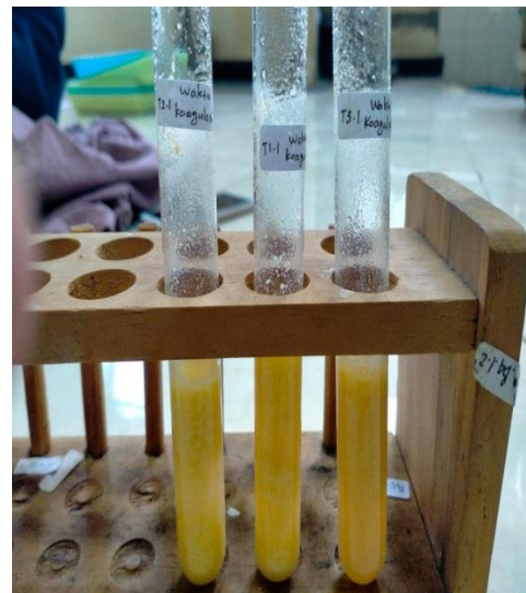
Proses pengukuran waktu koagulasi