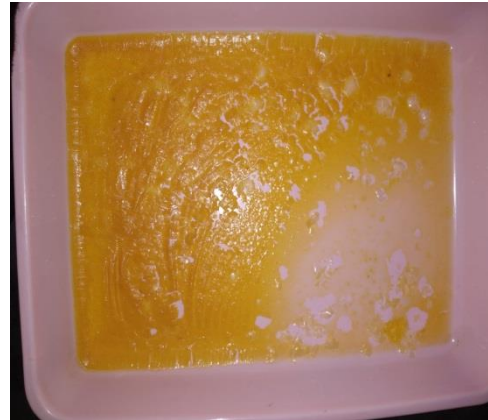
Tepung telur setelah pengeringan