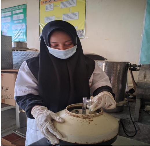
Proses pengukuran stabilitas emulsi