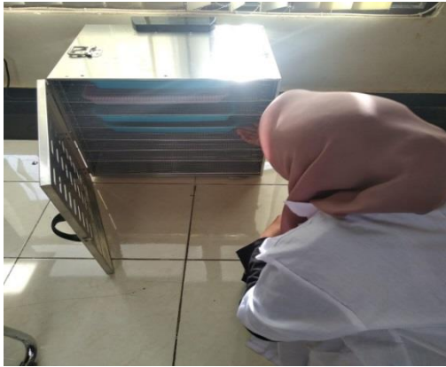
Proses pengeringan sampel tepung