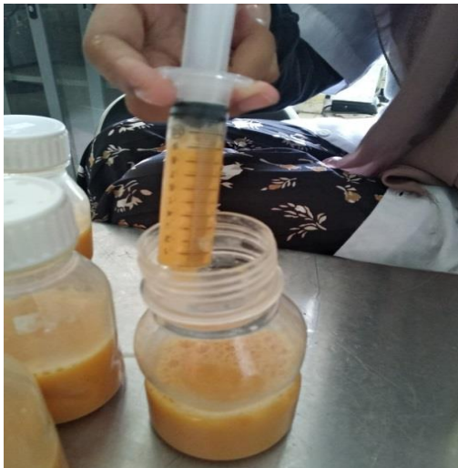
Proses penanaman starter