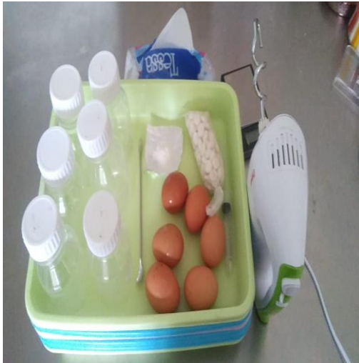
Alat dan bahan tepung telur