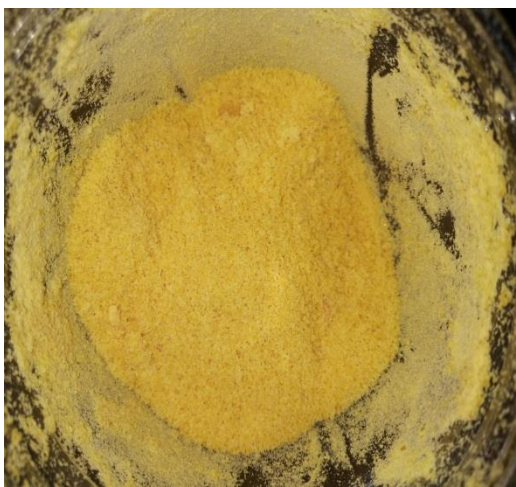
Proses penghalusan tepung telur