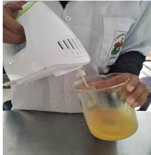
Proses pembuatan starter dan tepung