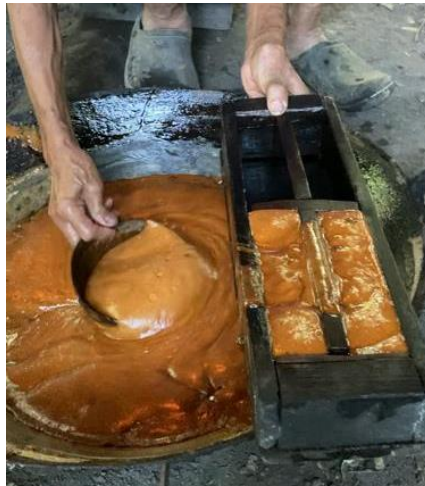
(5) Proses pencetakan gula aren