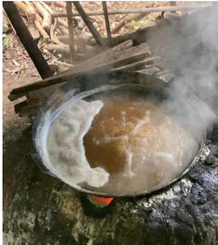
(4) Proses pemasakan nira