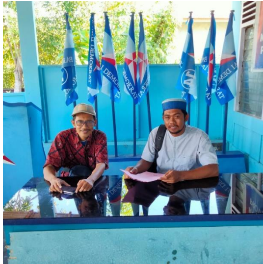
Sekretaris DPD Partai Demokrat Provinsi Sulawesi Tengah