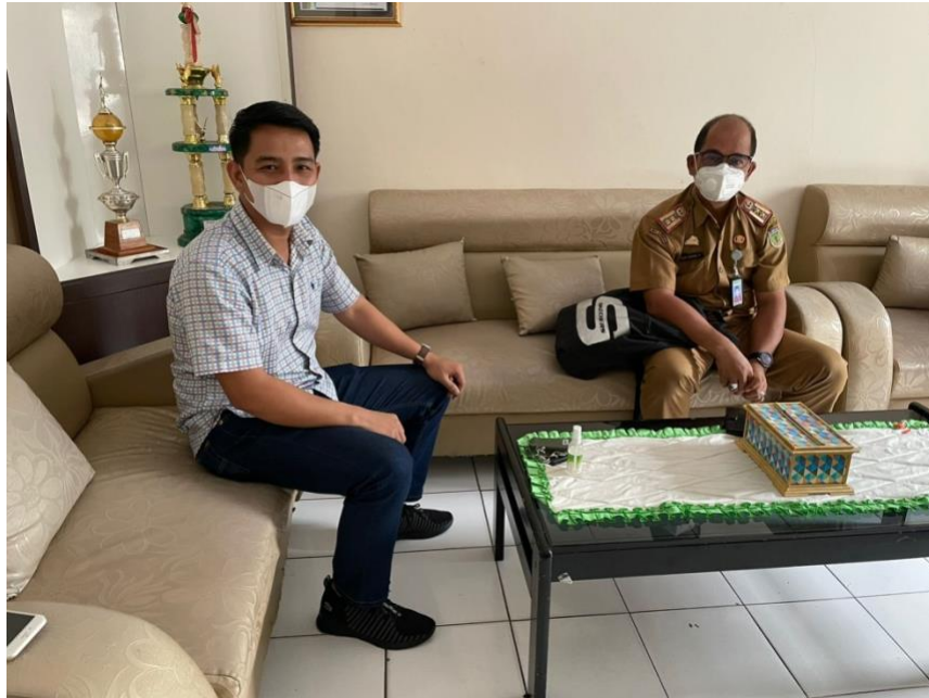
Foto bersama dengan Direktur Rumah Sakit Umum Daerah (RSUD) Lasinrang Kabupaten Pinrang