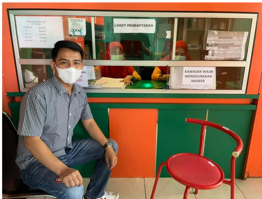
Foto di Loker Pendaftaran