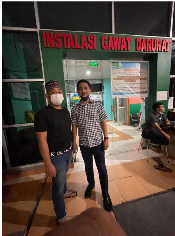
Foto bersama dengan keluarga pasien