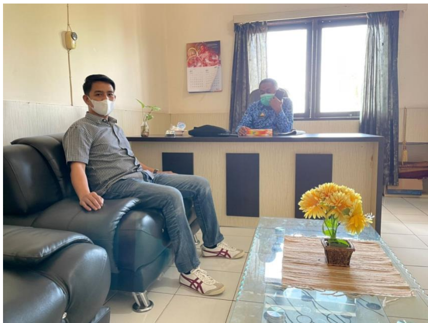
Foto bersama dengan Sek. Direktur Rumah Sakit Umum Daerah (RSUD) Lasinrang Kabupaten Pinrang