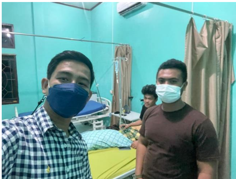
Foto bersama dengan pasien