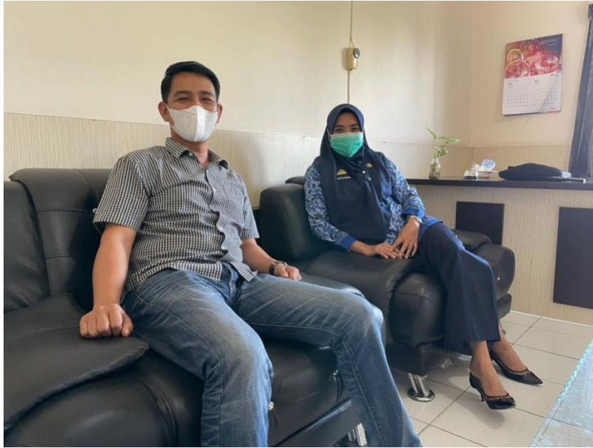
Foto bersama dengan Ka. Sub. Bag. Pelayanan dan Kepegawaian