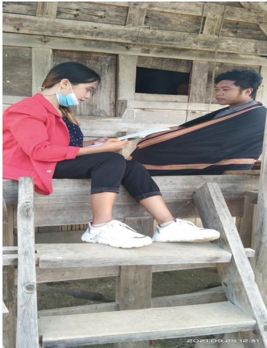
Informan R, 23 Tahun