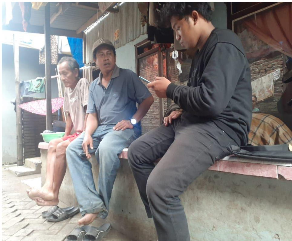
Gambar Wawancara dan Pengumpulan Informasi