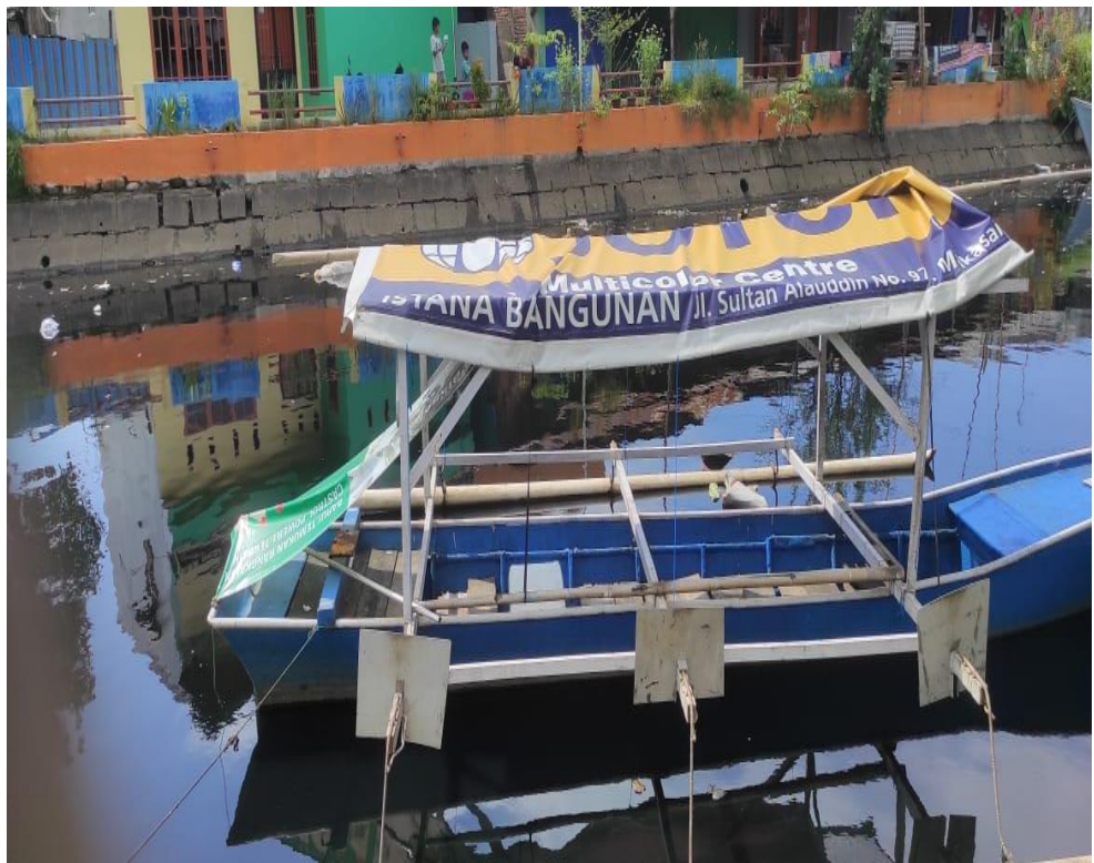
Gambar Kondisi Lokasi Penelitian