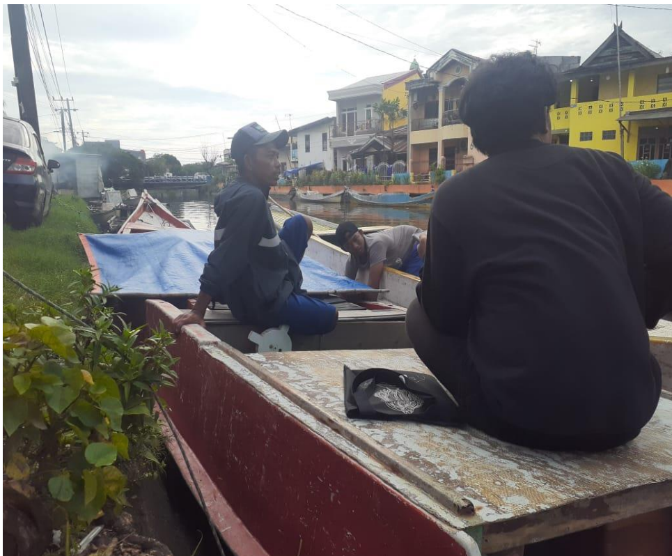
Gambar Wawancara dan pengumpulan informasi