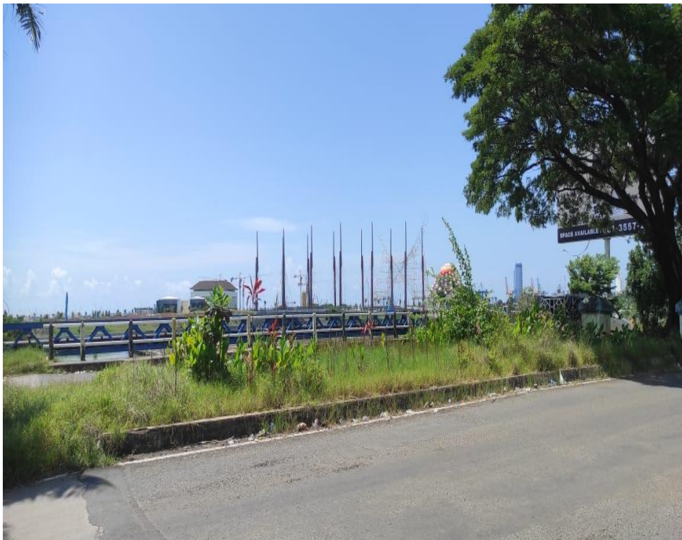
Gambar Bangunan CPI