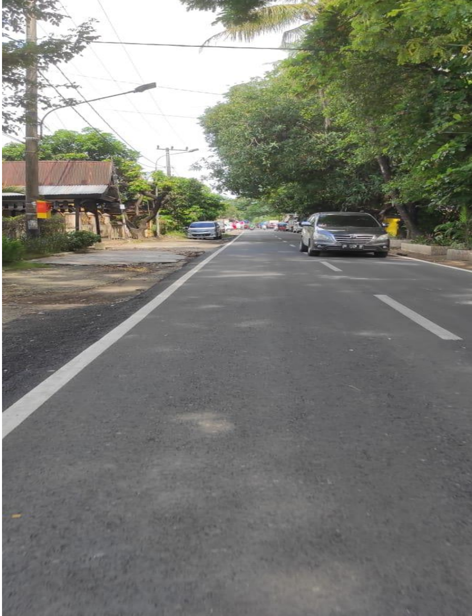
Gambar Kondisi Jalan Menuju Lokasi