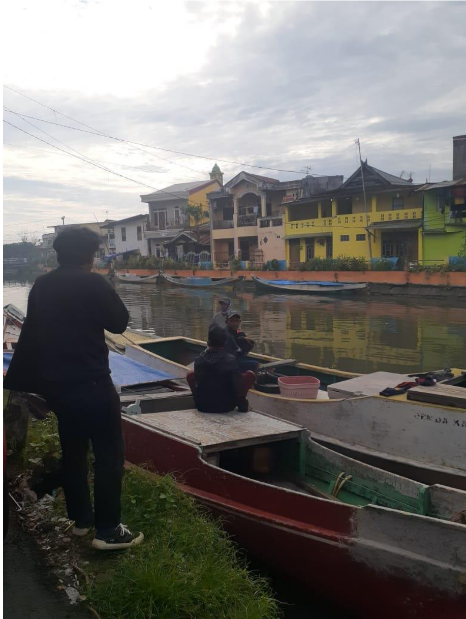
Gambar Wawancara dan Pengumpulan Informasi