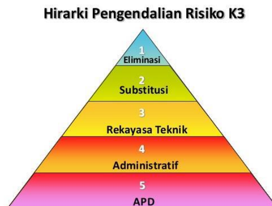
Gambar 2. Hirarki Pengendalian Risiko K3

Alat pelindung diri merupakan pilihan terakhir yang dapat kita lakukan untuk mencegah bahaya dengan pekerja. Akan tetapi penggunaan APD bukanlah pengendalian dari sumber bahaya itu. Alat pelindung diri sebaiknya tidak digunakan sebagai pengganti dari sarana pengendalian risiko lainnya. Alat pelindung diri ini disarankan hanya digunakan bersamaan dengan penggunaan alat pengendali lainnya. Dengan demikian perlindungan keamanan dan kesehatan personel akan lebih efektif. Keberhasilan penggunaan APD tergantung jika peralatan pelindungnya tepat pemilihannya, digunakan secara benar, sesuai dengan situasi dan kondisi bahaya serta senantiasa dipelihara. (Frank bird JR, 2014)