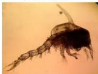
Gambar 7. Larva kepiting bakau stadia Zoea 5 (Gunarto et al. , 2016)

Pada Stadia zoea-5 panjang mencapai 3,43 mm, duri dorsal 1,31 mm, duri rostral 1,07 mm, duri lateral 0,32 mm, antenula dengan aesthetes dalam tiga tingkatan dan endopodite merupakan kuncup, seluruh periopod bertambah panjang dan mulai bersegmen. Dari stadia zoea ke dewasa, kepiting melakukan pergantian kulit (molting) sebanyak 20 kali. Pergantian kulit pada setiap stadia zoea berlangsung relatif cepat (3-4 hari), tergantung lingkungan (ketersediaan pakan) (Gambar 7).