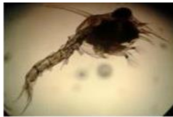
Gambar 6. Larva kepiting bakau stadia Zoea 4 (Gunarto et al. , 2016)

Stadia zoea-4 panjang 2,40 mm, duri dorsal 0,72 mm, duri lateral 0,28 mm, antenula mempunyai aesthetes panjang dan 2 seta serta sub-terminal, antenna mempunyai flagellum atau endopodite panjang (Gambar 6).