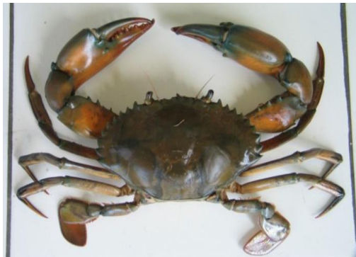
Gambar 1. Kepiting bakau spesies S. olivacea (Hartanto et al. , 2019)

4,91 hingga 11,79 cm, untuk lebar memiliki ukuran 7,56 cm hingga 15,21 cm (Larosa et al. , 2013) (Gambar 1).