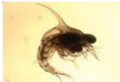
Gambar 3. Larva kepiting bakau stadia Zoea 1 (Gunarto et al. , 2016)

Pada tahapan zoea terdiri dari 5 tingkatan stadia. Menurut Karim (2013) menyatakan bahwa pada stadia zoea 1 larva kepiting berwarna transparan, Panjang tubuh mencapai 1,15 mm, duri-duri rostrum 0,35 mm, duri dorsal 0,48 mm, duri lateral 0,19 mm, mata menempel, antenulla tidak bersegmen serta pendek dan mempunyai aesthetes panjang, antena berduri Panjang, exopodite antenna yaitu duri pendek dan seta Panjang (Gambar 3).