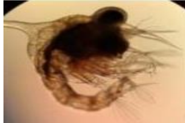
Gambar 5. Larva kepiting bakau stadia Zoea 3 (Gunarto et al. , 2016)

Stadia zoea-3 panjang mencapai 1,93 mm, duri rostrum 0,52 mm, duri dorsal 0,63 mm, duri lateral 0,24 mm, antenula seperti pada zoea-2 tetapi lebih besar, antenna merupakan kuncup kecil yang berpangkal pada flagellum (Gambar 5).