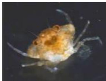
Gambar 9. Larva kepiting bakau stadia Crablet (Gunarto et al. , 2016)

Stadia ketiga adalah crablet atau juwana (kepiting muda) membutuhkan waktu kurang lebih 30-34 hari sejak telur menetas. Bentuk dan anggota tubuh crablet sudah seperti kepiting dewasa dan kebiasaannya cenderung di dasar perairan. Stadia ini dicapai setelah mengalami molting kurang lebih 20 kali sejak dari zoea, dan kepiting bakau sudah mulai dewasa pada ukuran panjang karapas 42,70 mm (Gambar 9).