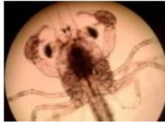
Gambar 8. Larva kepiting bakau stadia Megalopa (Gunarto et al. , 2016)

Stadia megalopa merupakan stadia kedua dalam tahap perkembangan kepiting bakau. Pada stadia megalopa ukuran tubuhnya semakin membesar, panjang karapas 2,18 mm (termasuk duri rostral) lebar karapas 1,52 mm, panjang abdomen 1,87 mm, panjang tubuh total (termasuk duri rostral) 4,1 mm, mempunyai pereopoda 5 pasang dan abdomen terdiri 7 segmen memanjang ke belakang (Gambar 8).