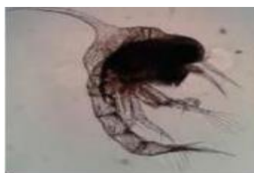
Gambar 4. Larva kepiting bakau stadia Zoea 2 (Gunarto et al. , 2016)

Pada stadia zoea 2 panjang tubuh mencapai 1,51 mm, duri rostrum 0,39 mm, duri dorsal 0,54 mm, duri lateral 0,2 mm, mata bertangkai, antenulla dengan 4 aesthetes dan 2 seta pendek yang panjangnya tidak sama antenna seperti pada substadia zoea-1 tetapi ukurannya berbeda (Gambar 4).