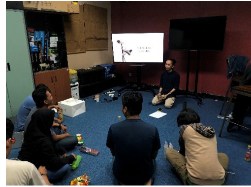
Proses Pre-Test yang dilakukan pada tanggal 30 Desember 2021