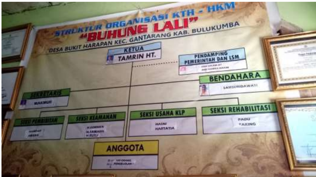
(Spanduk Struktur Organisasi KTH Buhung Lali)