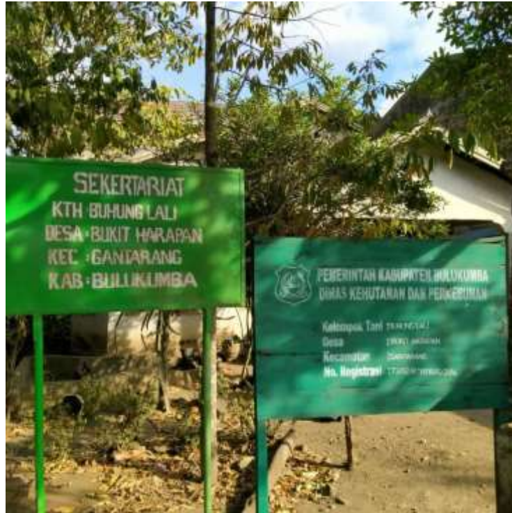
(Gambar Penanda Sekretariat KTH Buhung Lali)