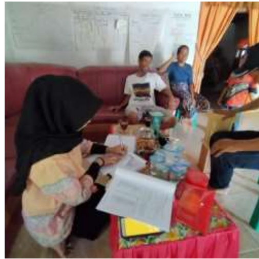
(Wawancara dengan Pengurus KTH Buhung Lali)