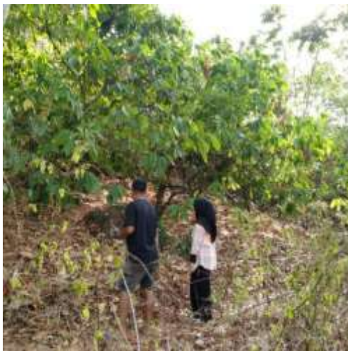
(Meninjau lokasi HKm Bangkeng Bukit)