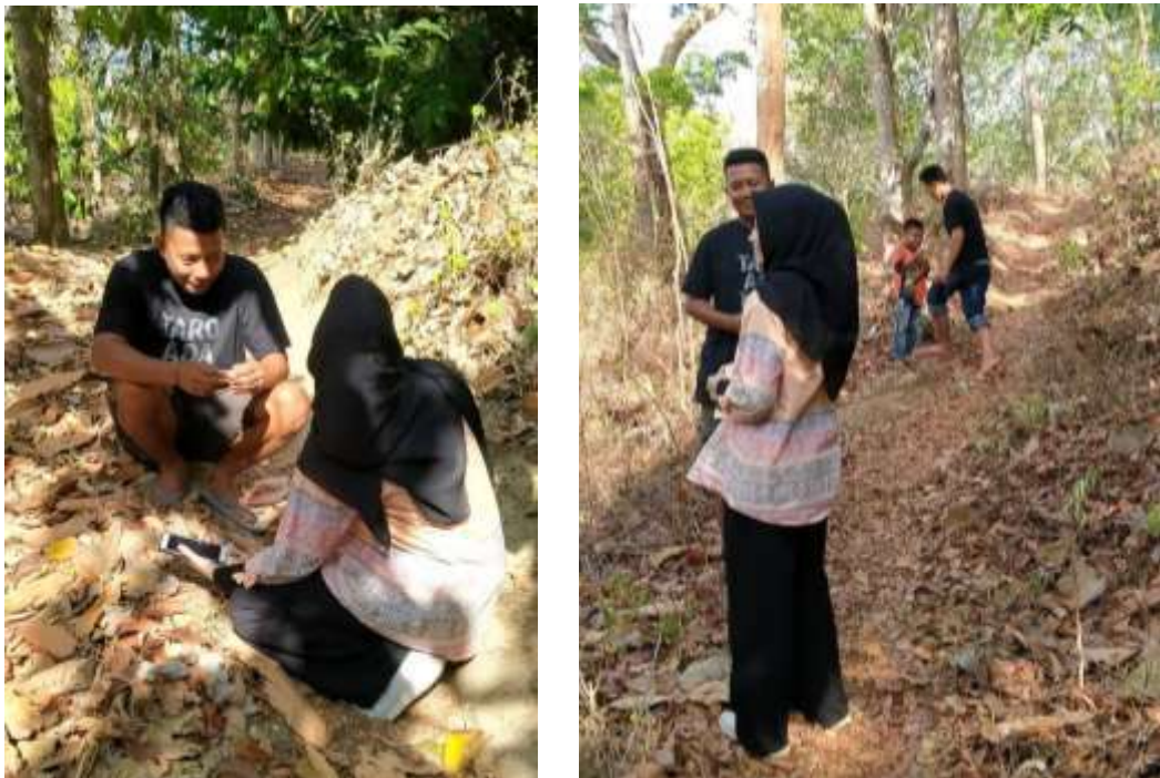
(Gambar wawancara masyarakat di lokasi HKm Bangket Bukit)