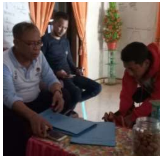
(Wawancara dengan pihak Dinas Kehutanan)