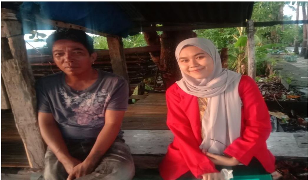
Keterangan : Pinggir Pantai Mattirotasi Kecamatan Ujung Sebelah Barat Kota Parepare, Responden sedang berbincang dengan nelayan lain