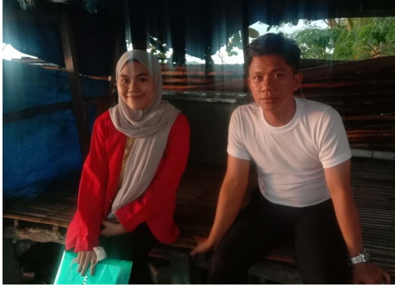
Keterangan : Pinggir Pantai Mattirotasi, Lokasi Pendaratan Kapal Nelayan, Kecamatan Ujung Sebelah Barat Kota Parepare, Responden baru saja Melakukan Pekerjaan Sampingan sebagai Tukang Ojek di Sore Hari