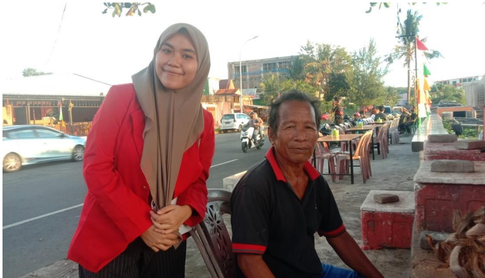
Keterangan : Pinggir Pantai Mattirotasi Kecamatan Ujung Sebelah Barat Kota Parepare, Responden Sedang Melakukan Pekerjaan Sampingannya Yakni Berdagang Campuran