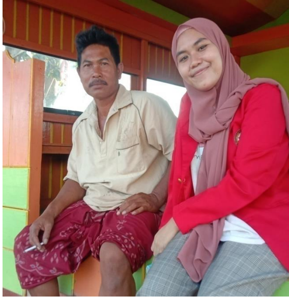
Keterangan : Pinggir Pantai Mattirotasi Kecamatan Ujung Sebelah Barat Kota Parepare, Responden sedang berbincang dengan nelayan lain