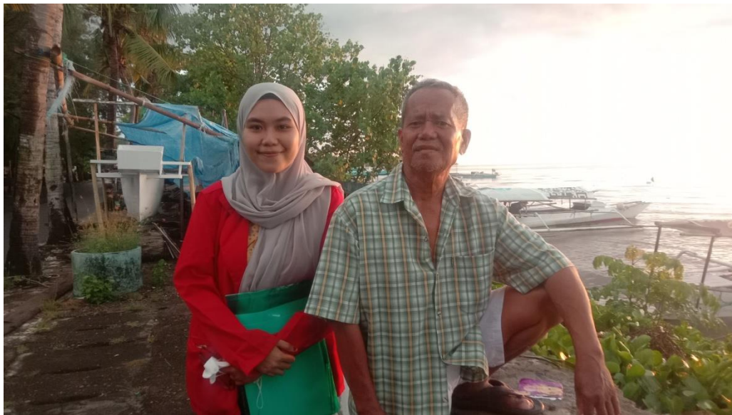
Keterangan : Pinggir Pantai Mattirotasi Kecamatan Ujung Sebelah Barat Kota Parepare, Responden Sedang Melakukan Pekerjaan Sampingannya Yakni Memperbaiki Kapal