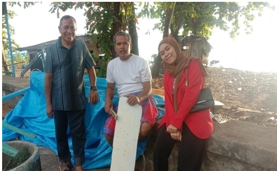
Keterangan : Pinggir Pantai Mattirotasi Kecamatan Ujung Sebelah Barat Kota Parepare, Responden Sedang Melakukan Pekerjaan Transaksi dengan Pembeli Ikannya