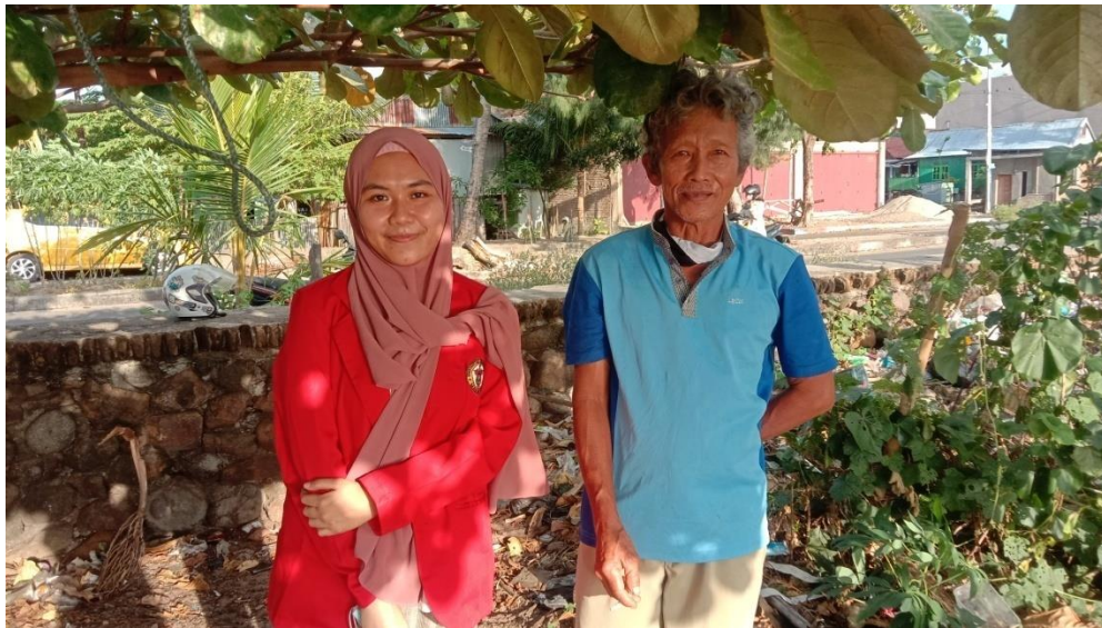
Keterangan : Pinggir Pantai Mattirotasi, Lokasi Pendaratan Kapal Nelayan, Kecamatan Ujung Sebelah Barat Kota Parepare, Responden sedang berbincang dengan nelayan lain