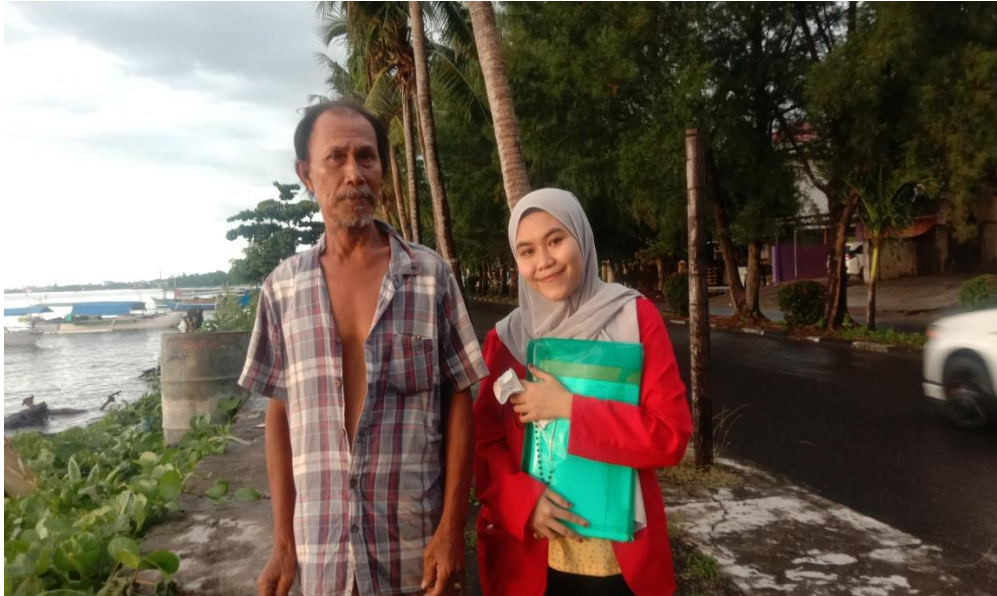
Keterangan : Pinggir Pantai Mattirotasi Kecamatan Ujung Sebelah Barat Kota Parepare, Responden sedang menghitung hasil tangkapan