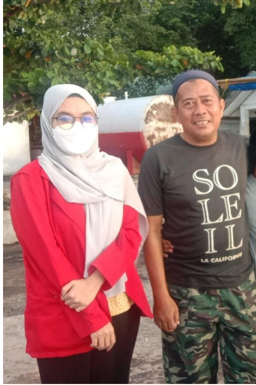
Keterangan : Pinggir Pantai Cempae, Tempat Pelelangan Ikan, Kecamatan Soreang Kota Parepare, Responden Baru Saja Menjual Hasil Tangkapannya.