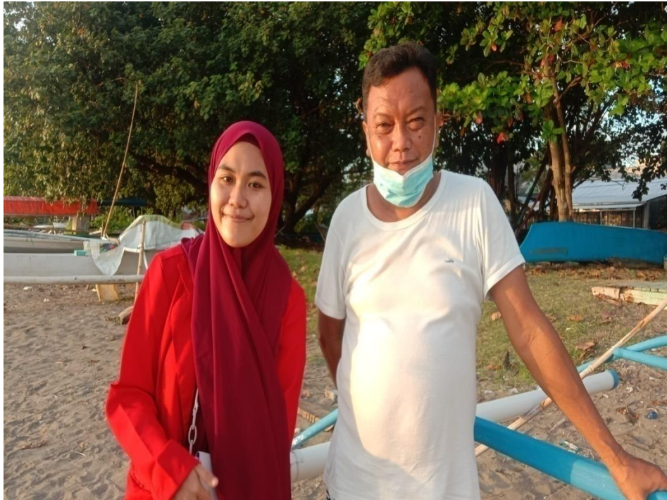
Keterangan : Pinggir Pantai Mattirotasi Kecamatan Ujung Sebelah Barat Kota Parepare, Responden baru saja Menyandarkan Kapal Tangkapan