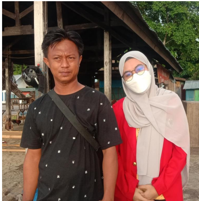
Keterangan : Pinggir Pantai Cempae, Tempat Pelelangan Ikan, Kecamatan Soreang Kota Parepare, Responden Baru Saja Menjual Hasil Tangkapannya.