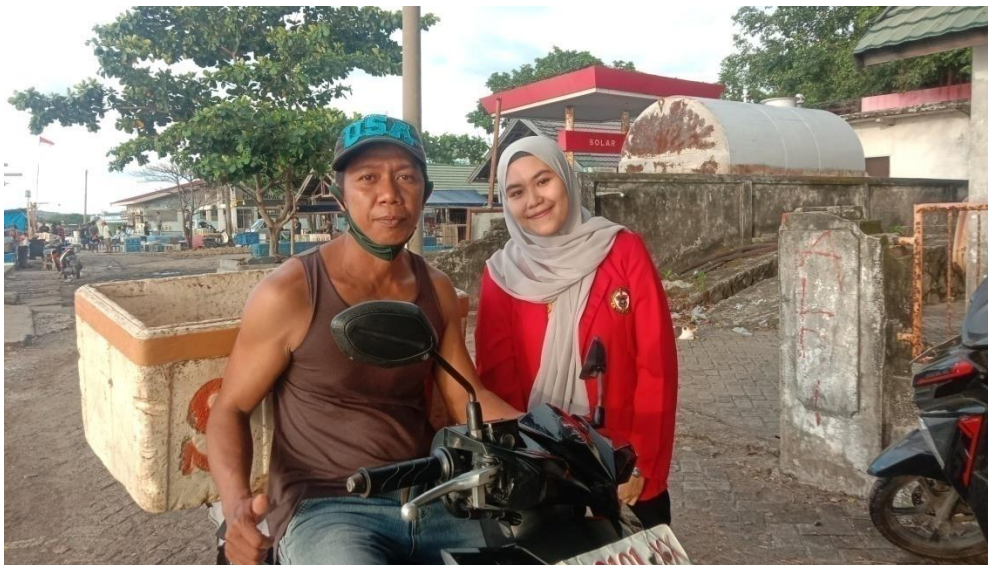
Keterangan : Pinggir Pantai Cempae, Tempat Pelelangan Ikan, Kecamatan Soreang Kota Parepare, Responden Baru Saja Mengantarkan Hasil Tangkapannya.