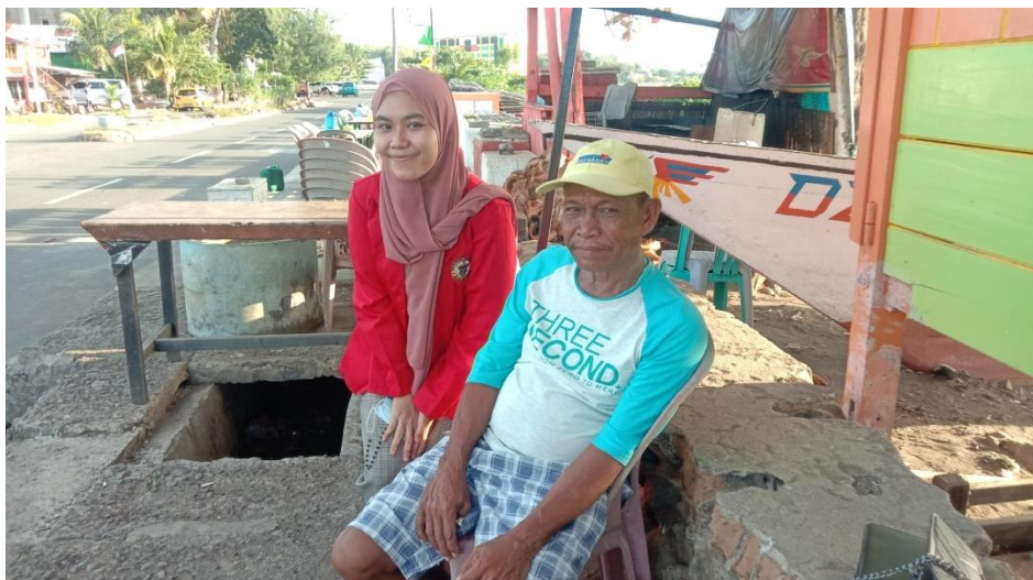
Keterangan : Pinggir Pantai Mattirotasi Kecamatan Ujung Sebelah Barat Kota Parepare, Responden Sedang Melakukan Pekerjaan Sampingannya Yakni Berdagang Campuran