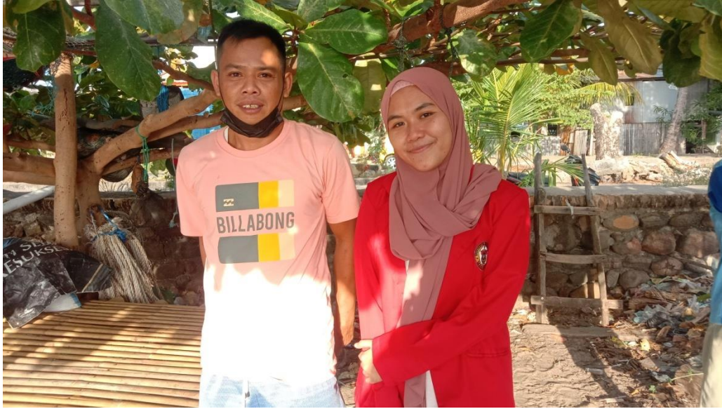
Keterangan : Pinggir Pantai Mattirotasi, Lokasi Pendaratan Kapal Nelayan, Kecamatan Ujung Sebelah Barat Kota Parepare, Responden sedang berbincang dengan nelayan lain