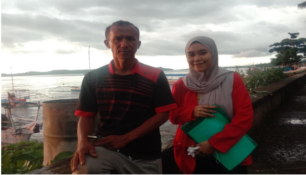
Keterangan : Pinggir Pantai Mattirotasi Kecamatan Ujung Sebelah Barat Kota Parepare, Responden sedang berbincang dengan nelayan lain