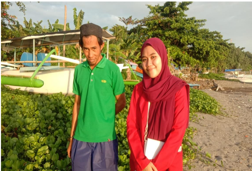
Keterangan : Pinggir Pantai Mattirotasi Kecamatan Ujung Sebelah Barat Kota Parepare, Responden baru saja Menyandarkan Kapal Tangkapan