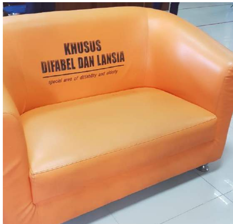
Tempat khusus lansia dan difabel