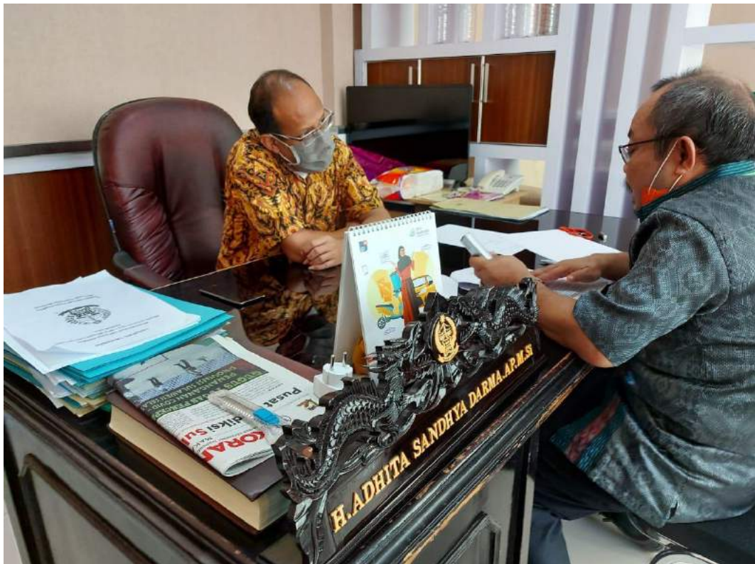
Wawancara dengan Kabid TSI BAPENDA