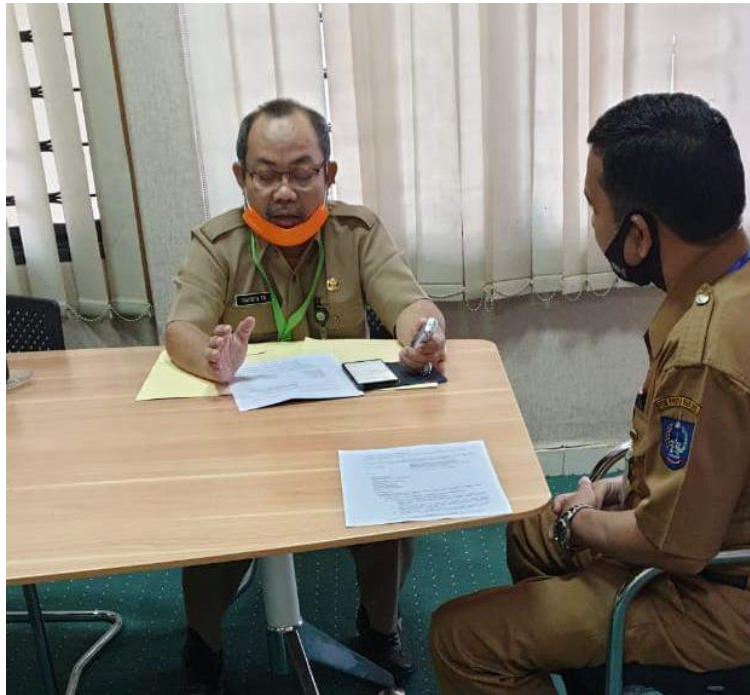
Wawanvara di Gowa