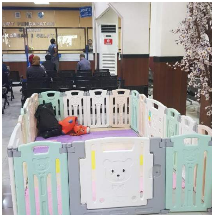
Tempat bermain anak di Samsat Makassar 1