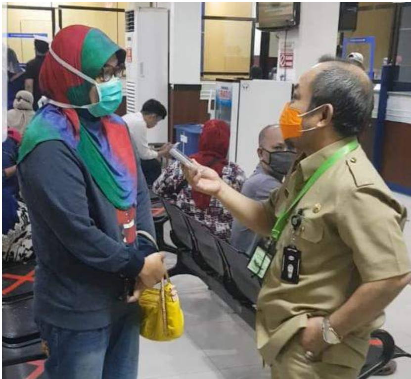
Wawancara wajib pajak di makassar 1