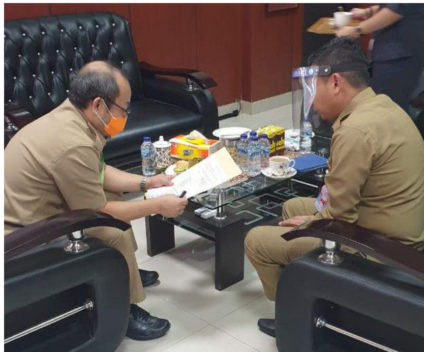
Wawancara di Samsat Bantaeng