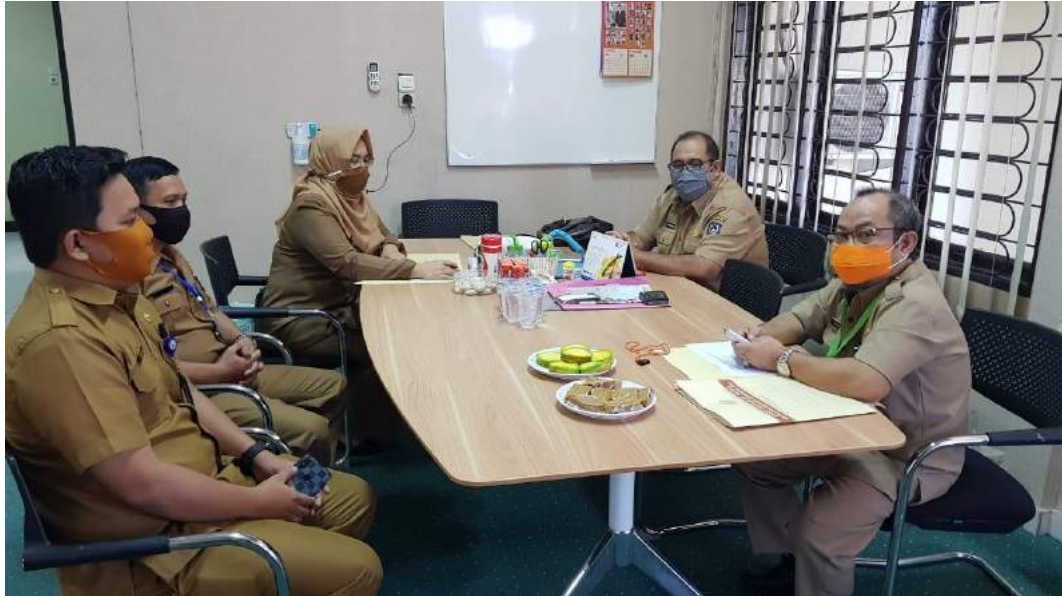
Wawancara dan Silaturahmi dengan Pimpina dan STG UPT Gowa