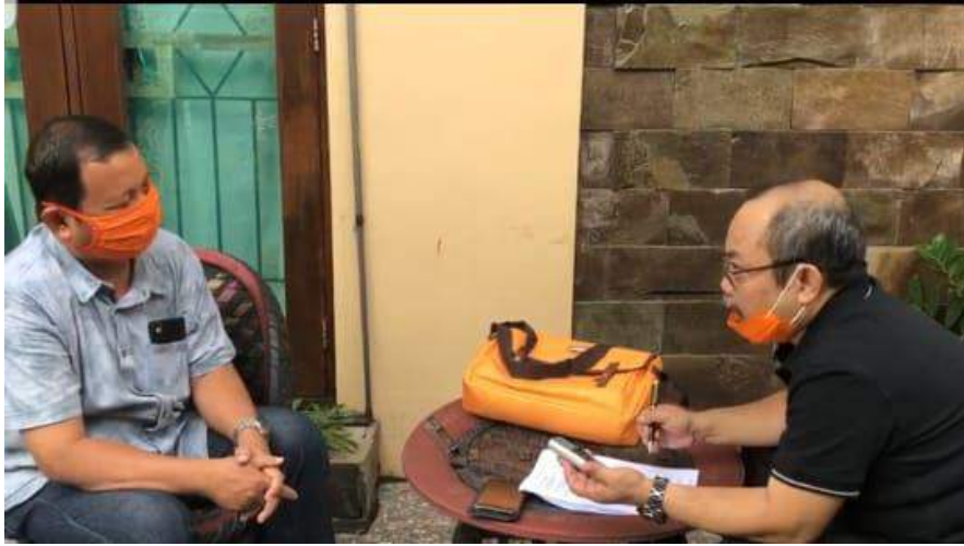
Wawancara Wajib Pajak