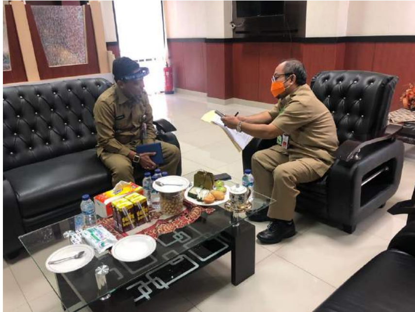
Wawancara petugas samsat di Pangkep