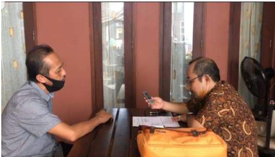
Wawancara Wajib Pajak