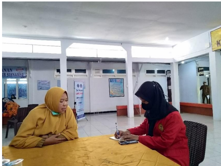
WAWANCARA PENGELOLA GAJI DINAS KETENAGAKERJAAN