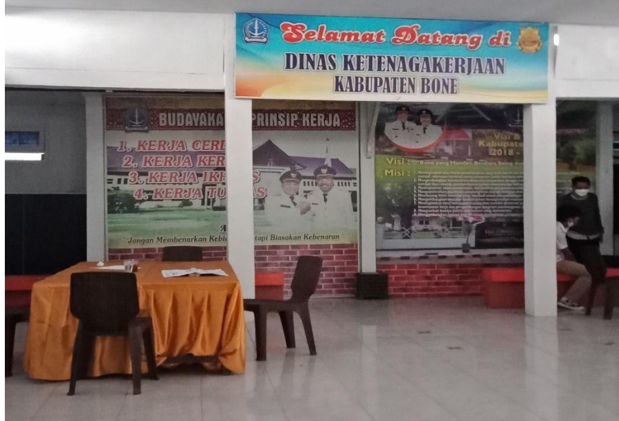
KANTOR DINAS KETENAGAKERJAAN KABUPATEN BONE