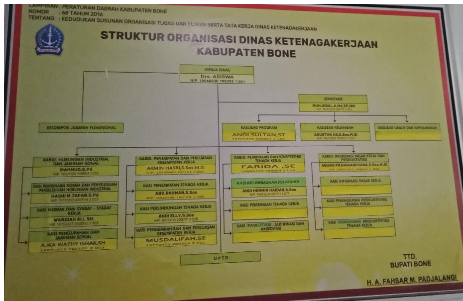
STRUKTUR ORGANISASI DINAS KETENAGAKERJAAN KAB.BONE