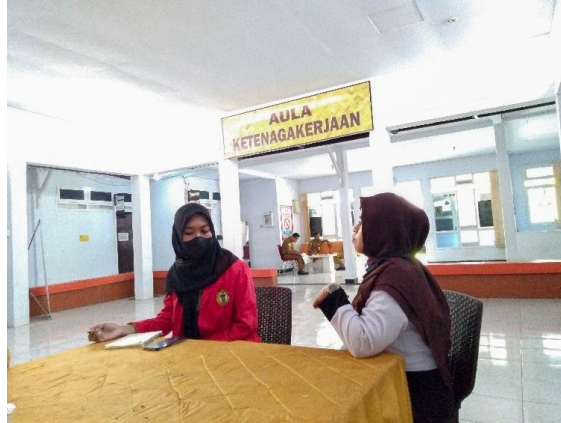
WAWANCARA DENGAN PENGELOLA BIDANG DINAS KETENAGAKERJAAN