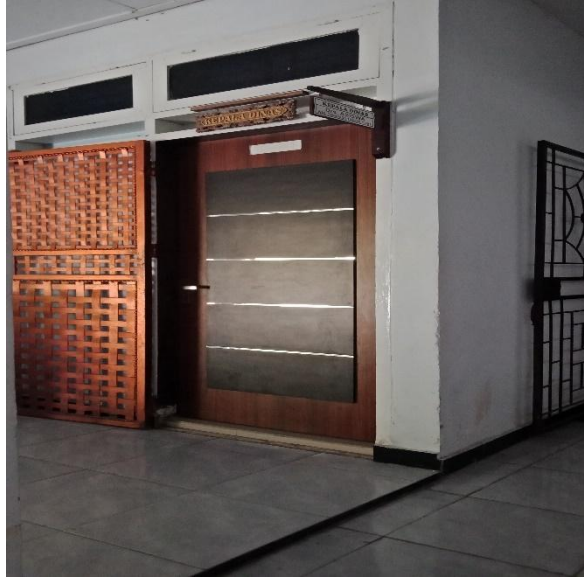
RUANGAN KEPALA DINAS KETENAGAKERJAAN KABUPATEN BONE