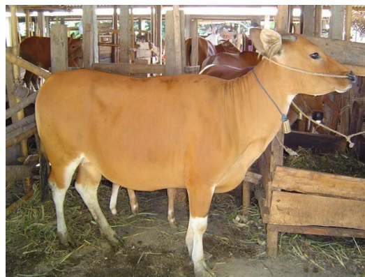
Gambar 1. Sapi Bali

Sapi Bali ( Bos sondaicus ) merupakan sapi asli Indonesia yang diduga sebagai hasil domestikasi (penjinakan) dari banteng liar. Sebagian ahli yakin bahwa domestikasi tersebut berlangsung di Bali sehingga disebut sapi Bali. Sapi Bali telah tersebar hampir di seluruh provinsi di Indonesia dan berkembang cukup pesat di banyak daerah karena memiliki beberapa keunggulan. Sapi Bali mempunyai daya adaptasi yang baik terhadap lingkungan yang buruk, seperti daerah yang besuhu tinggi, mutu pakan yang rendah/kasar, dan lain-lain (Guntoro, 2002). Matondang dan Talib (2015) menyatakan bahwa Sapi Bali merupakan salah satu sapi terbaik di dunia karena memiliki beberapa keunggulan dibandingkan dengan rumpun sapi lainnya. Hal ini antara lain adalah memiliki fertilitas dan persentase karkas tinggi dan mampu beradaptasi dengan baik pada lingkungan.