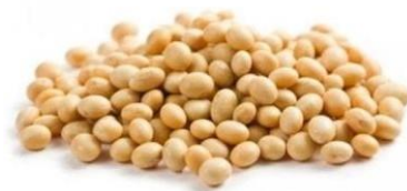
Gambar 2. Kacang Kedelai

Pemilihan bahan pengencer yang baik dapat berpengaruh bagi kehidupan spermatozoa sehingga dapat menghasilkan kualitas semen yang berkualitas pula. Bahan pengencer semen harus mempunyai kriteria tidak beracun, berenergi, mampu mempertahankan kualitas semen, bersifat sebagai pelindung, buffer, antibiotika, isotonis, keseimbangan mineral dan krioprotektan yang baik untuk kehidupan spermatozoa, dan bahan anti cold shock (Hardijanto dkk, 2010). Bahan pengencer yang dapat digunakan sebagai pengencer yaitu kacang kedelai. Berikut penampakan kacang kedelai dapat dilihat pada gambar 2.