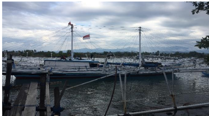
Gambar 1. Bagan perahu

Bagan ( lift net ) merupakan salah satu jenis alat tangkap ikan yang menggunakan cahaya sebagai alat bantu penangkapan untuk menarik perhatian ikan yang bersifat fototaksis positif (Sulaiman, 2015). Selanjutnya dinyatakan bahwa bagan perahu ( boat lift net ) adalah alat penangkapan ikan yang dioperasikan dengan cara diturunkan ke kolom perairan dan diangkat kembali setelah banyak ikan di atasnya, dalam pengoperasian menggunakan perahu untuk berpindahpindah ke lokasi lain yang diperkirakan banyak ikan. Salah satu cara yang dapat dilakukan untuk meningkatkan pendapatan pada usaha perikanan tangkap adalah mengusahakan unit penangkapan yang produktif, yakni dengan jumlah hasil tangkapan yang optimal.