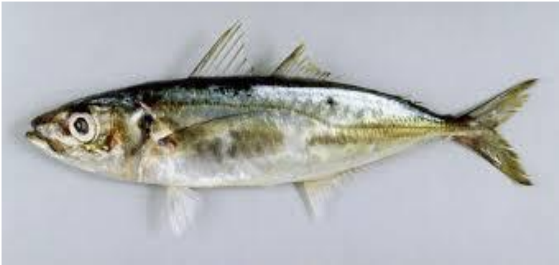
Gambar 1 Ikan Layang

Klasifikasi ikan layang menurut Saanin (1968) adalah sebagai berikut: