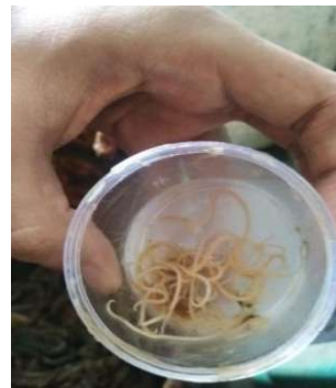
Sampel cacing Ascaridia galli