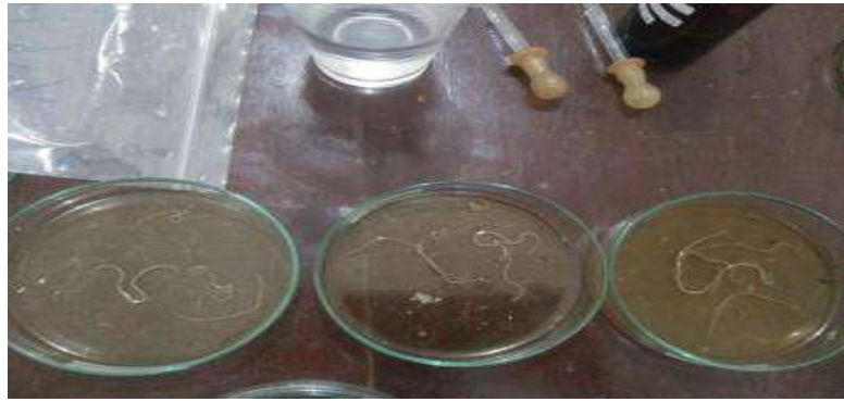
Pemberian ekstrak 10%, 15 %, dan 20 %