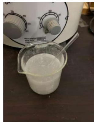
Membuat larutan NaCMC 0,5%