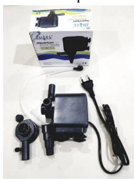
Pompa AQ YP1600