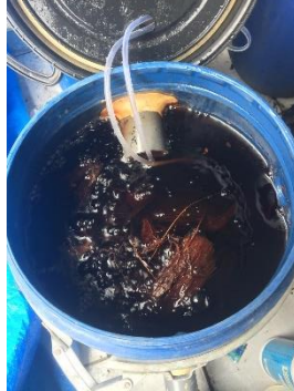
Media Biofilter Sabut dan Tempurung Kelapa