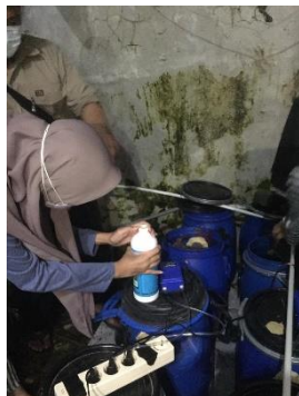
Penambahan EM4 dan air bilasan beras