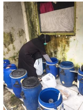
Pengisian media ke dalam reaktor