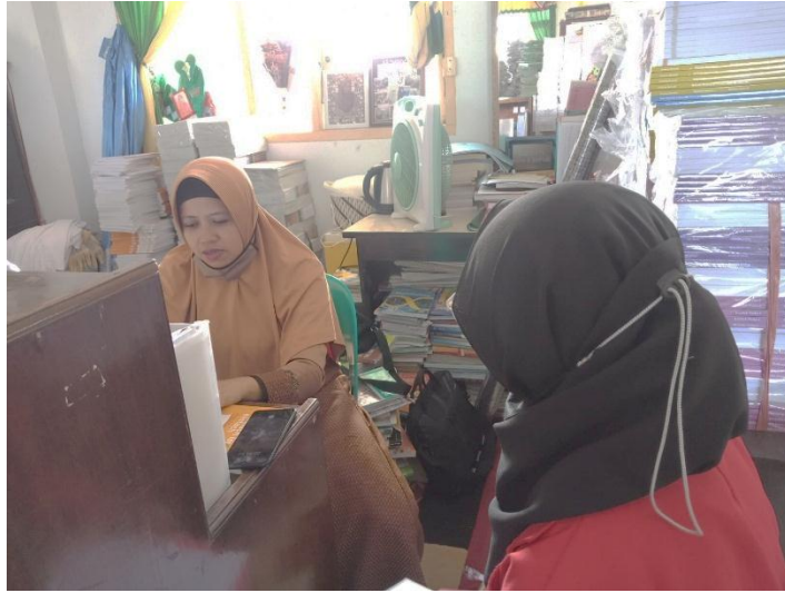
Wawancara dengan informan 9