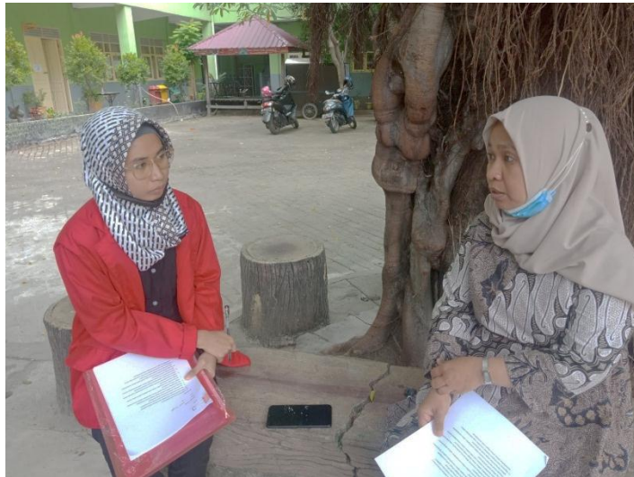
Wawancara dengan informan 8