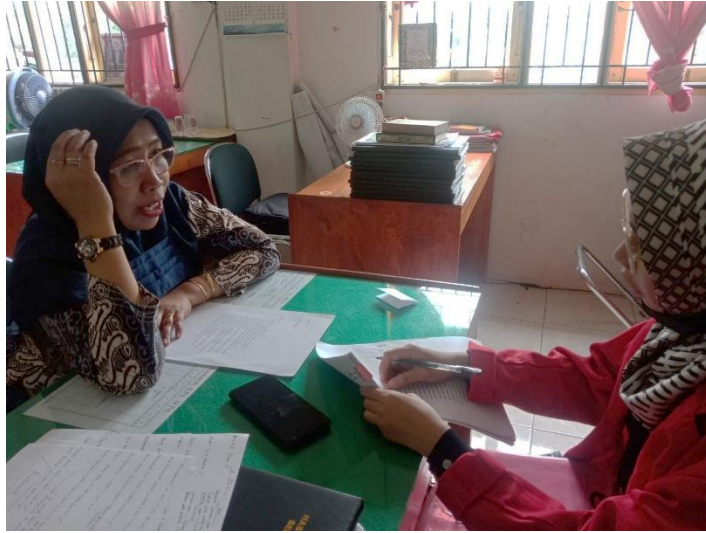
Wawancara dengan informan 7