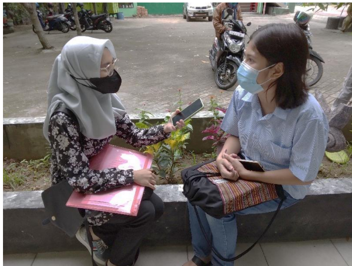
Wawancara dengan informan 4