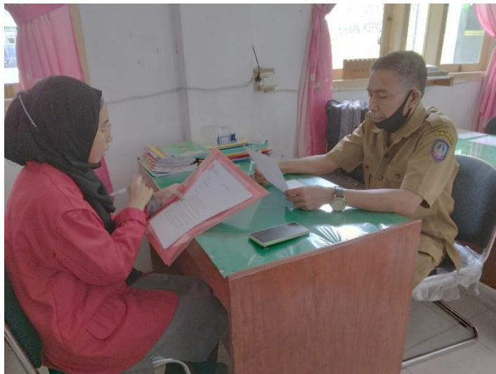
Wawancara dengan informan 6