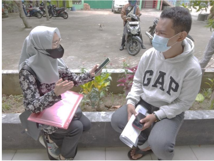
Wawancara dengan informan 5