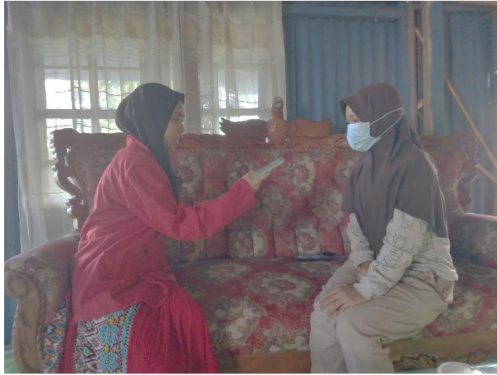
Wawancara dengan informan 3