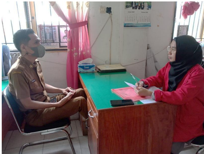
Wawancara dengan informan 10