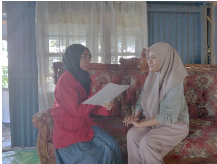
Wawancara dengan informan 2