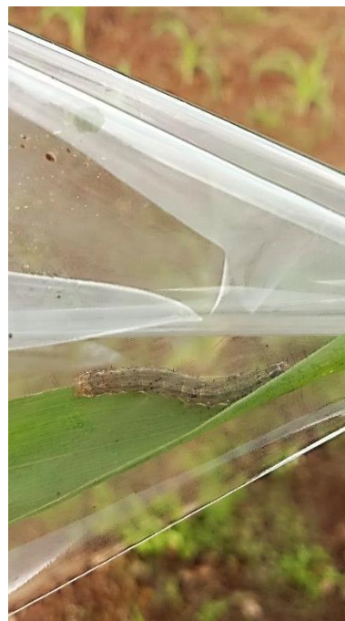
Gambar 9. Larva Spodoptera frugiperda