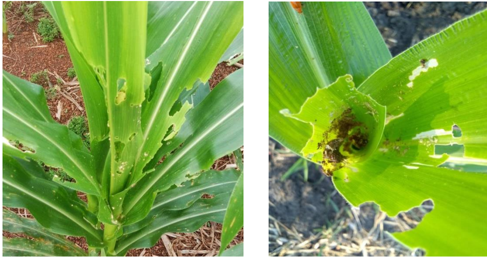
Gambar 10. Gejala Serangan Larva Spodoptera frugiperda