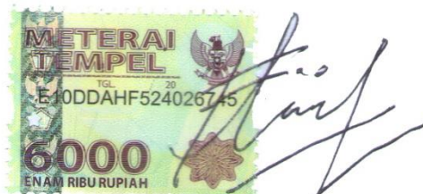
Miftahul Khaer A11116526