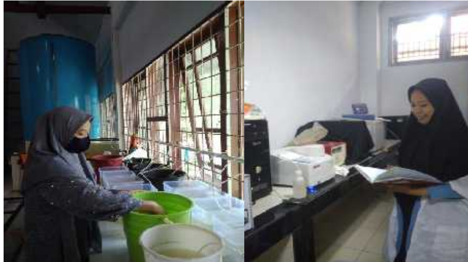
Gambar 14. Proses percobaan penelitian. (a): Rancangan penelitian; (b): Analisis \text{NH}_3 & \text{H}_2\text{S} dengan metode spektrofotometer