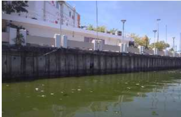
Gambar 9. Gambaran lokasi pengambilan sampel air limbah Pantai Losari