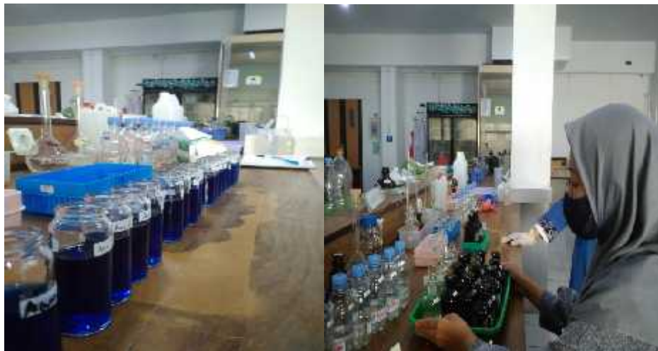
Gambar 12. Sampel yang dianalisis menggunakan metode spektrofotometer. (a): Sampel amoniak ( \text{NH}_3 ); (b): Sampel hidrogen sulfida ( \text{H}_2\text{S} ).