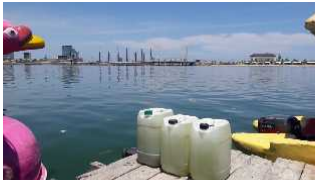
Gambar 10. Proses pengambilan sampel air limbah Pantai Losari