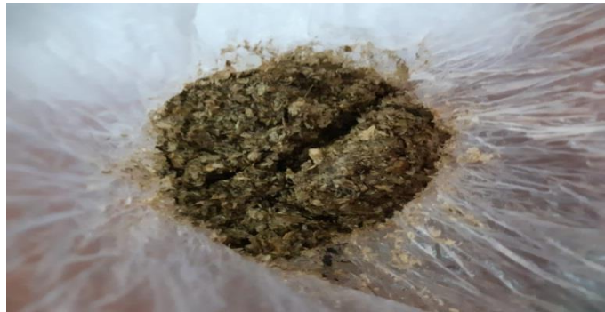
Tekstur tumpi jagung