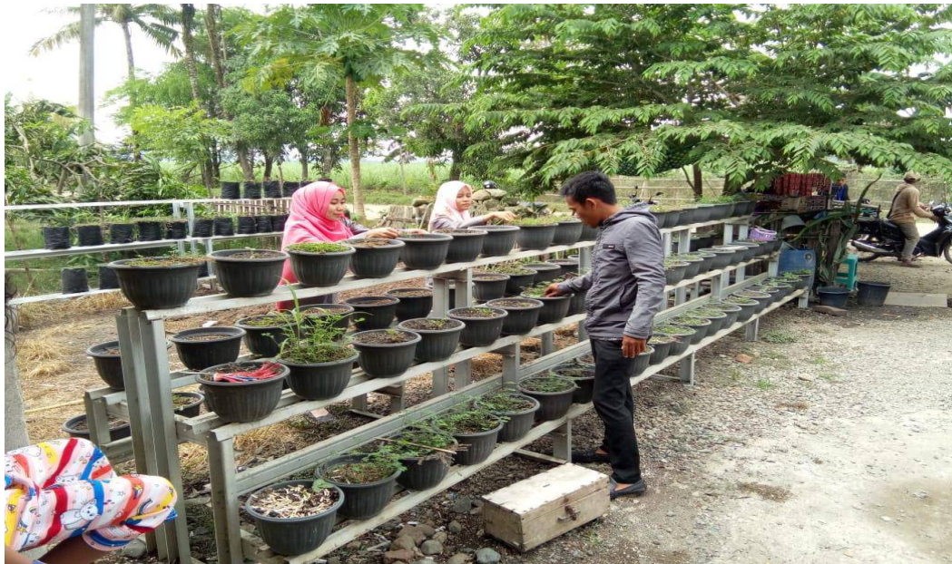
Foto kegiatan pengembangan ekonomi kreatif, dengan bercocok tanam buah strobery. Bertempat di Dusun Lacuco, yang digagas langsung oleh pemuda.