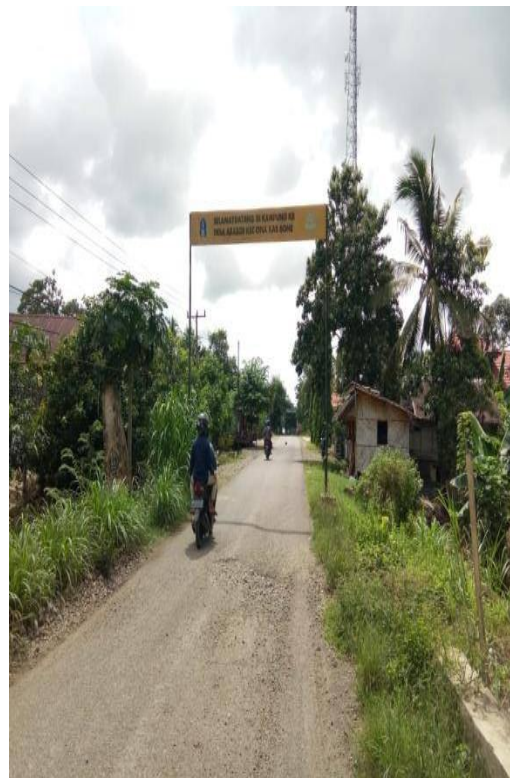
Foto kondisi Desa Arasoe.