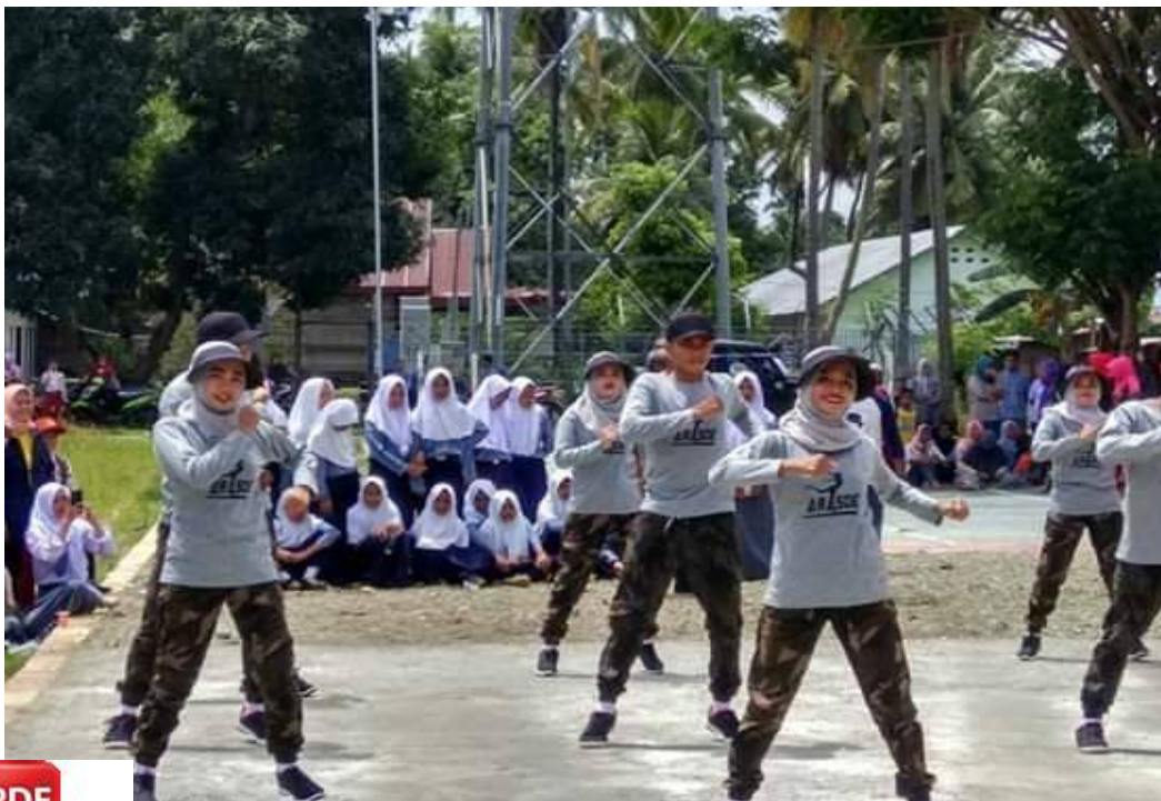
giatan pertandingan senam, oleh pemuda Desa Arasoe.