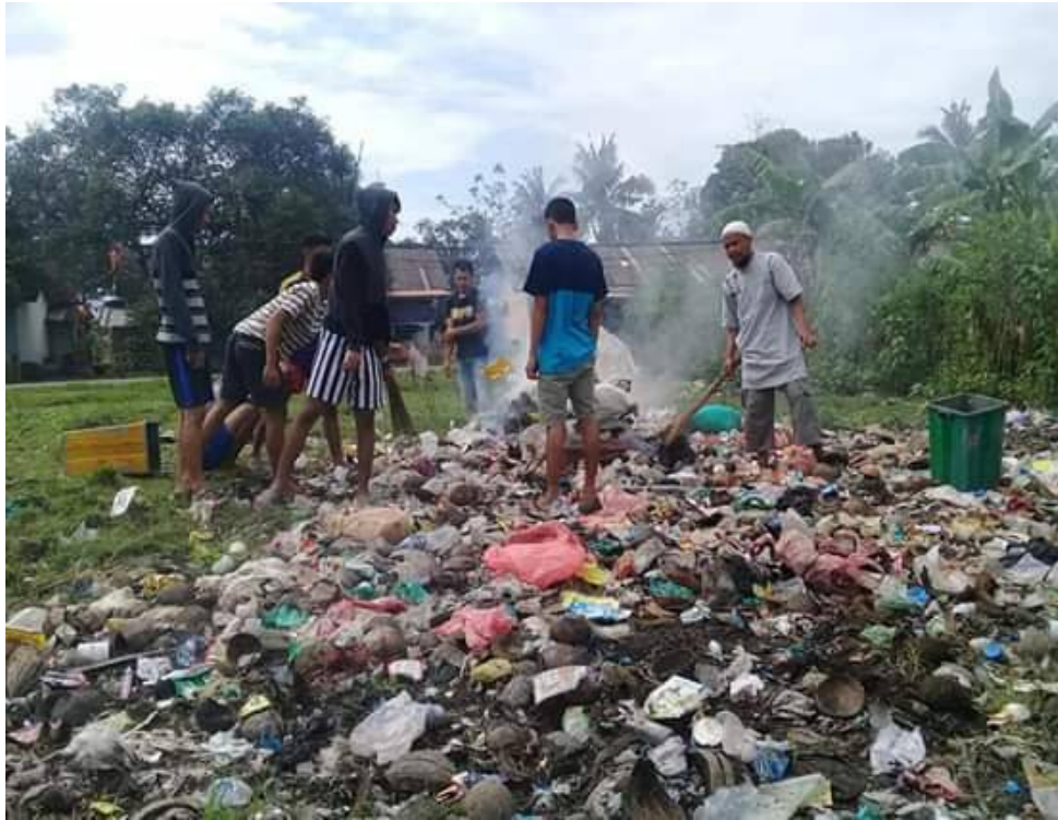
Foto kegiatan jumat bersih, bekerja sama pemuda dengan tokoh masyarakat.