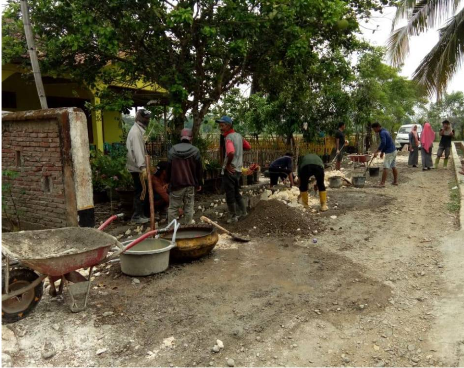
Foto kegiatan pembangunan drainase di Dusun Kompleks pasar, yang didominasi oleh pemuda.