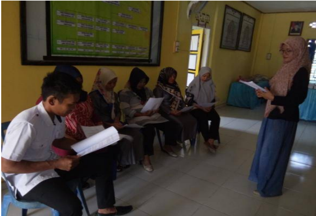
Foto kegiatan FGD bersama perangkat desa usai jam istirahat.