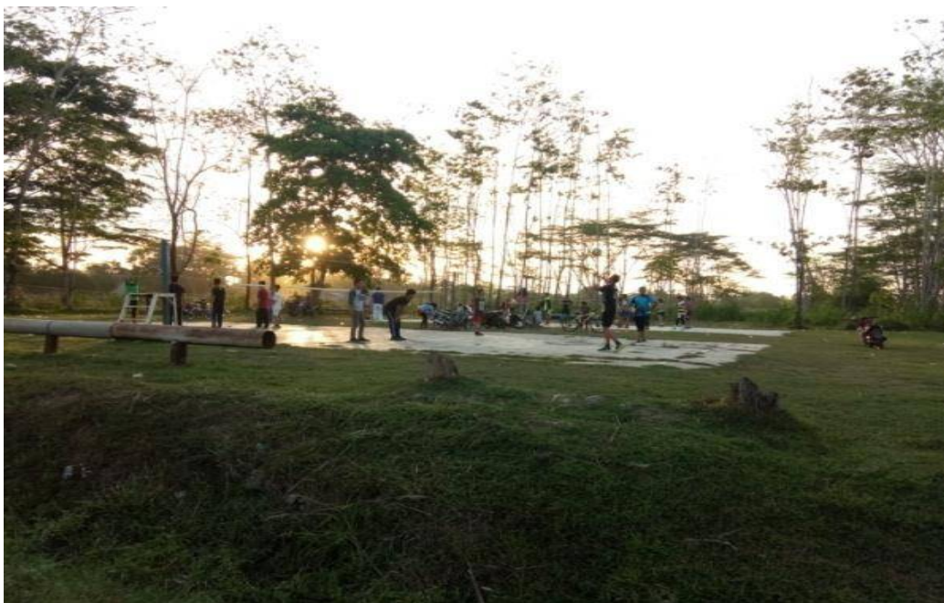
Foto kegiatan pengembangan kepemudaan dibidang olahraga, yang di fasilitasi oleh pemuda.