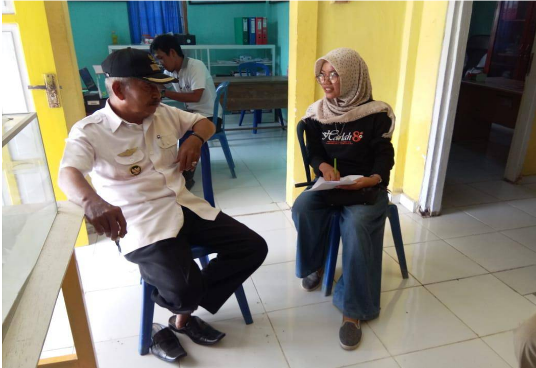
Foto kegiatan wawancara bersama Kepala Desa Arasoe, yang bertempat di Kantor Desa.