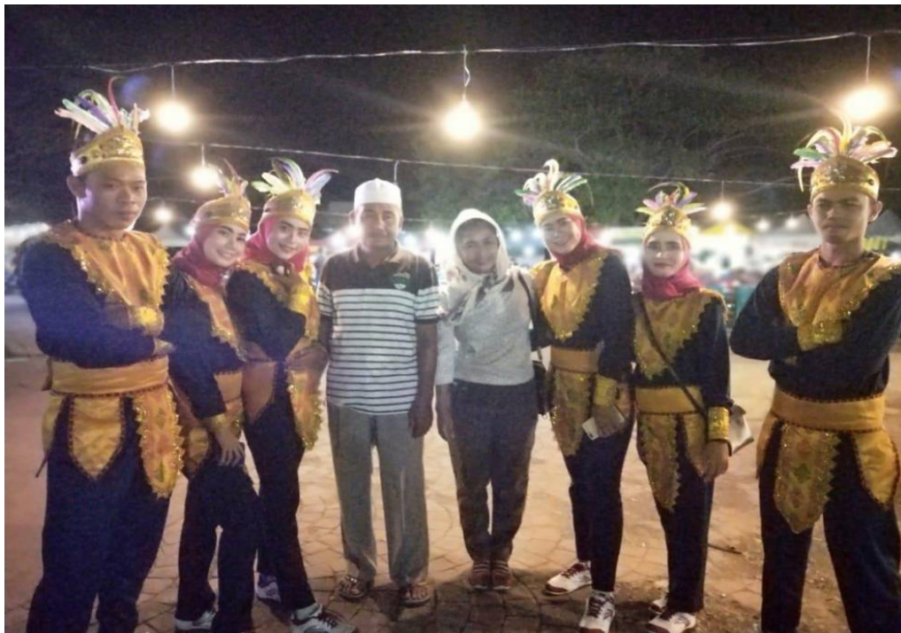
Foto kegiatan pemuda pada perayaan 17 Agustus 2019.