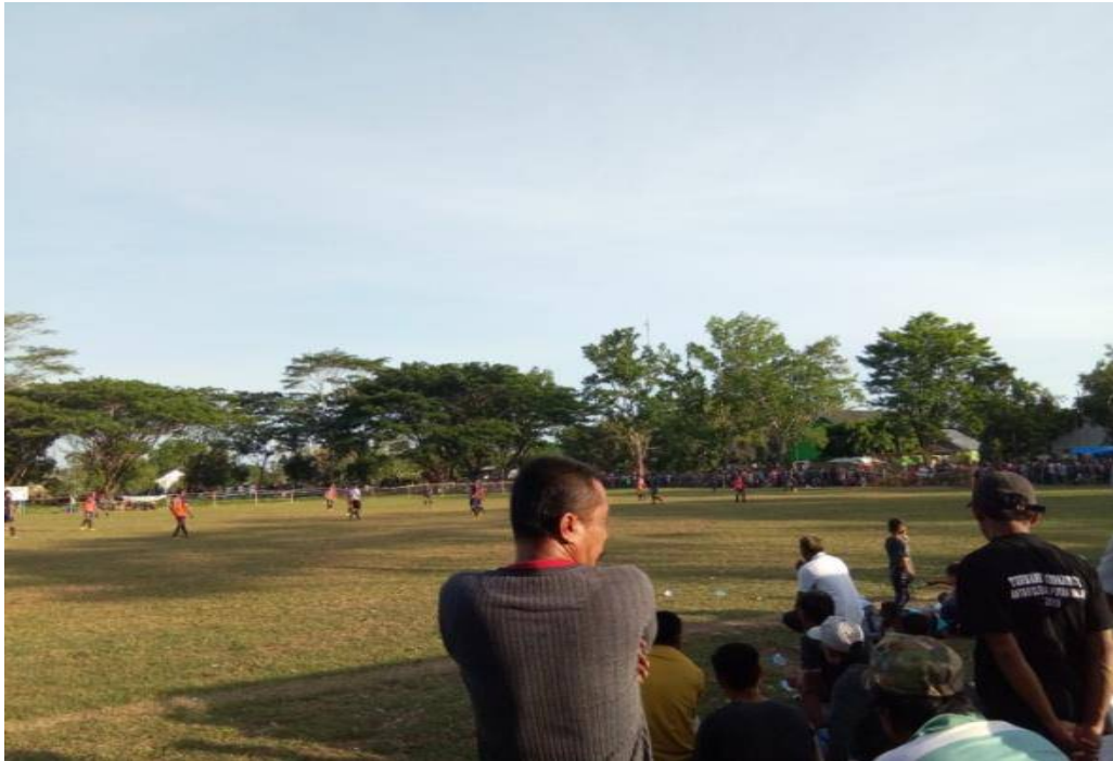
Foto kegiatan pertandingan sepak bola yang diselenggarakan oleh pemuda Desa Arasoe.