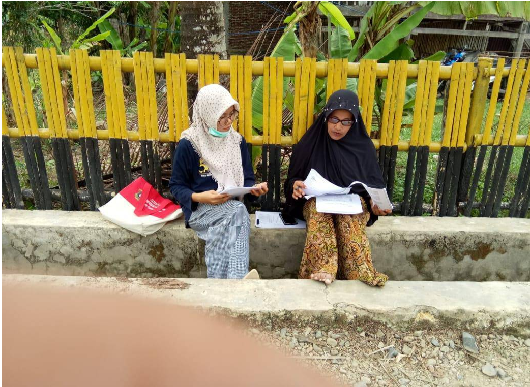
Foto kegiatan wawancara bersama perangkat desa, di lokasi kegiatan pembangunan.