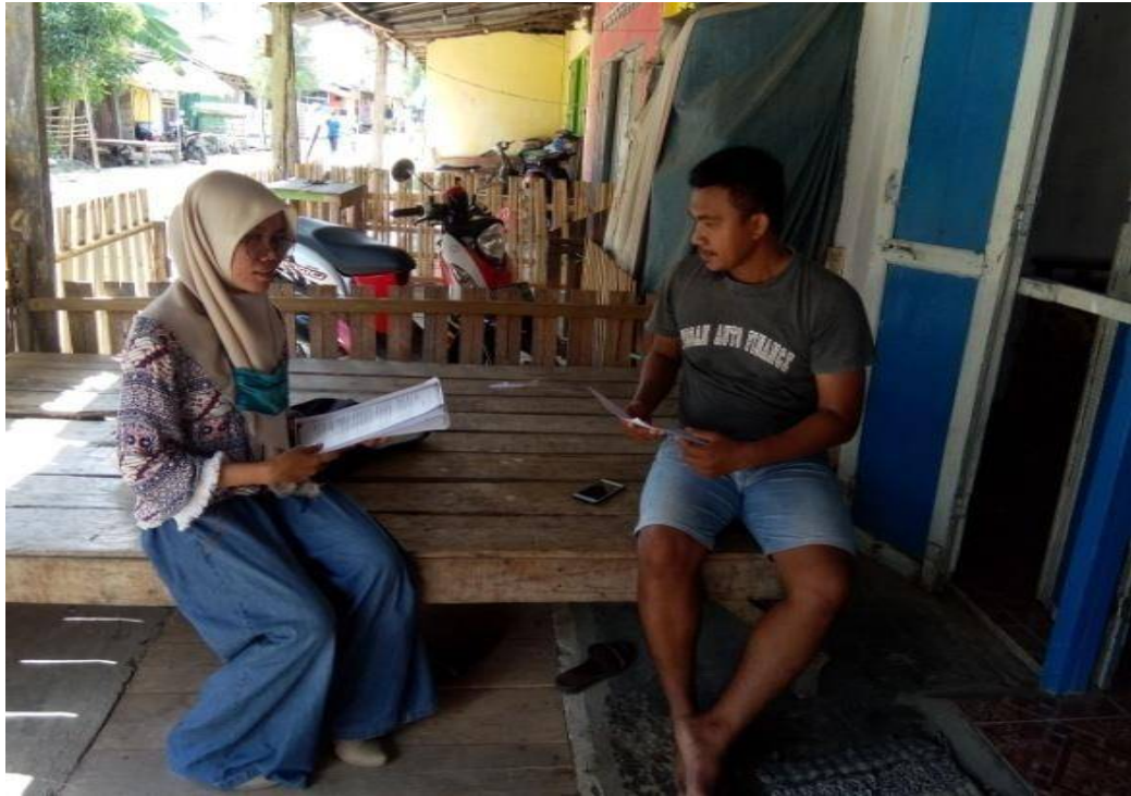
Foto kegiatan wawancara bersama kelompok pemuda, dikediaman masing-masing.