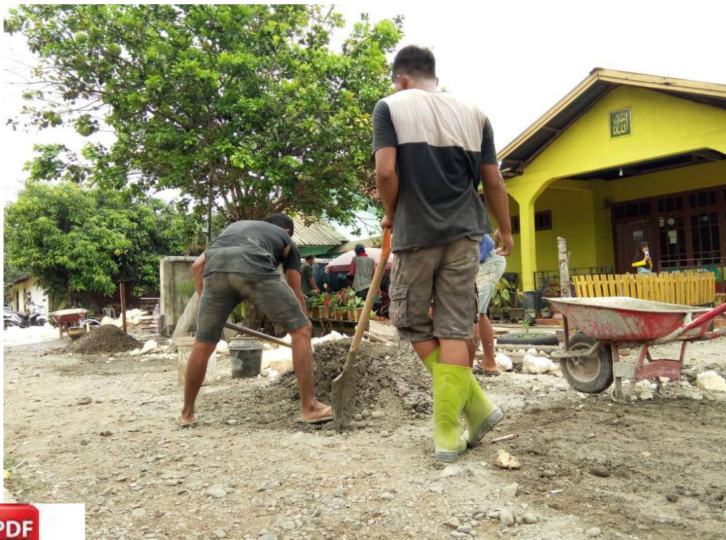
giatan pembangunan drainase.