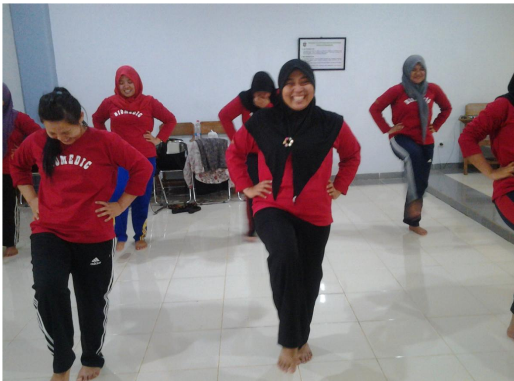
5. Gerakan Jalan di tempat dengan Variasi Gerakan