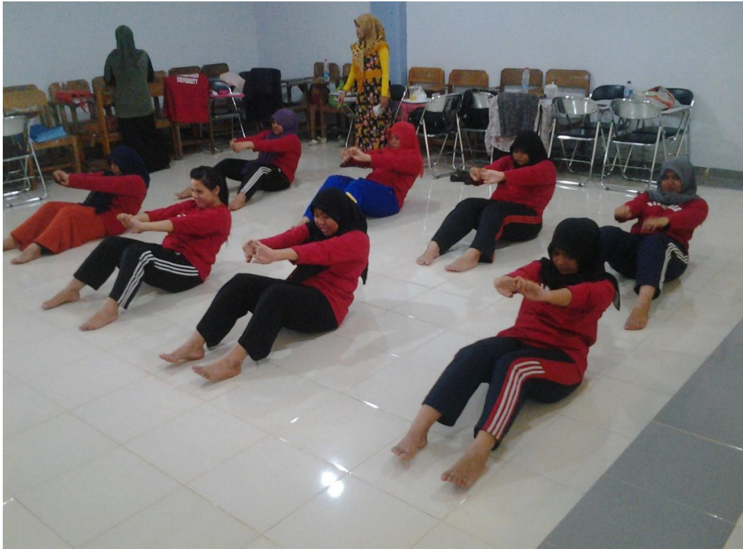
4. Gerakan Sit Ups