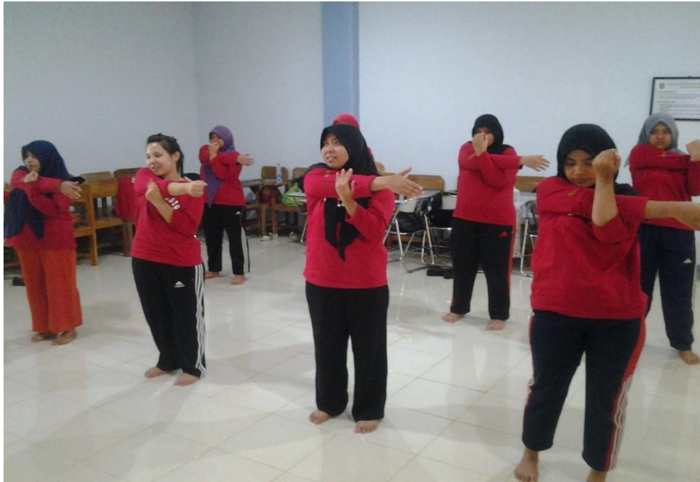
Gerakan Stretching (warming up)