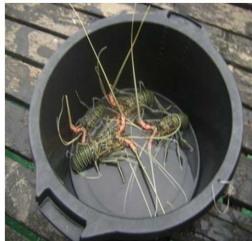
Gambar 12. Hasil Tangkapan Nelayan