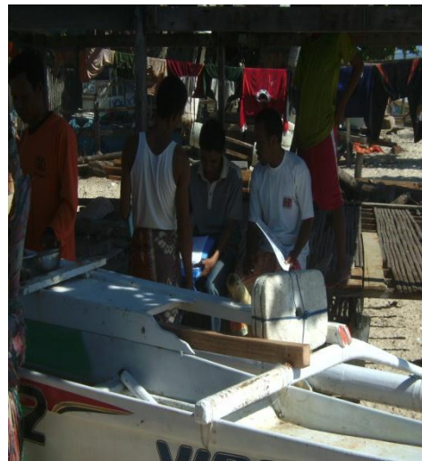
Gambar 11. Wawancara Masyarakat Nelayan Pulau Badi dan Pajenekang