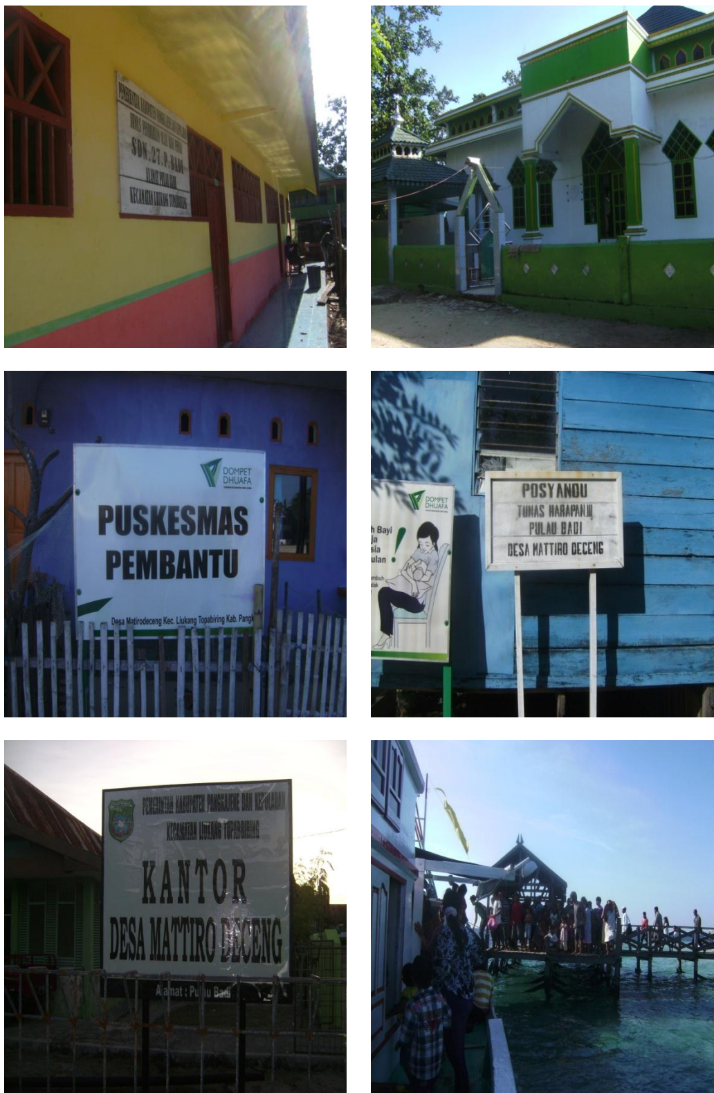
Gambar 15. Sarana dan Prasarana Pulau Badi