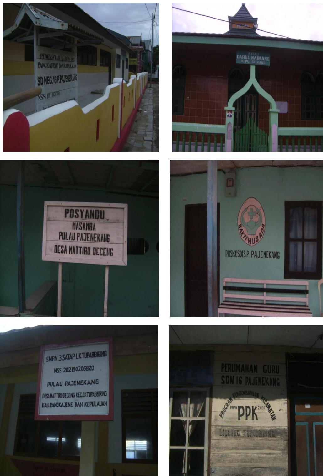
Gambar 14. Sarana dan Prasarana Pulau Pajenekang