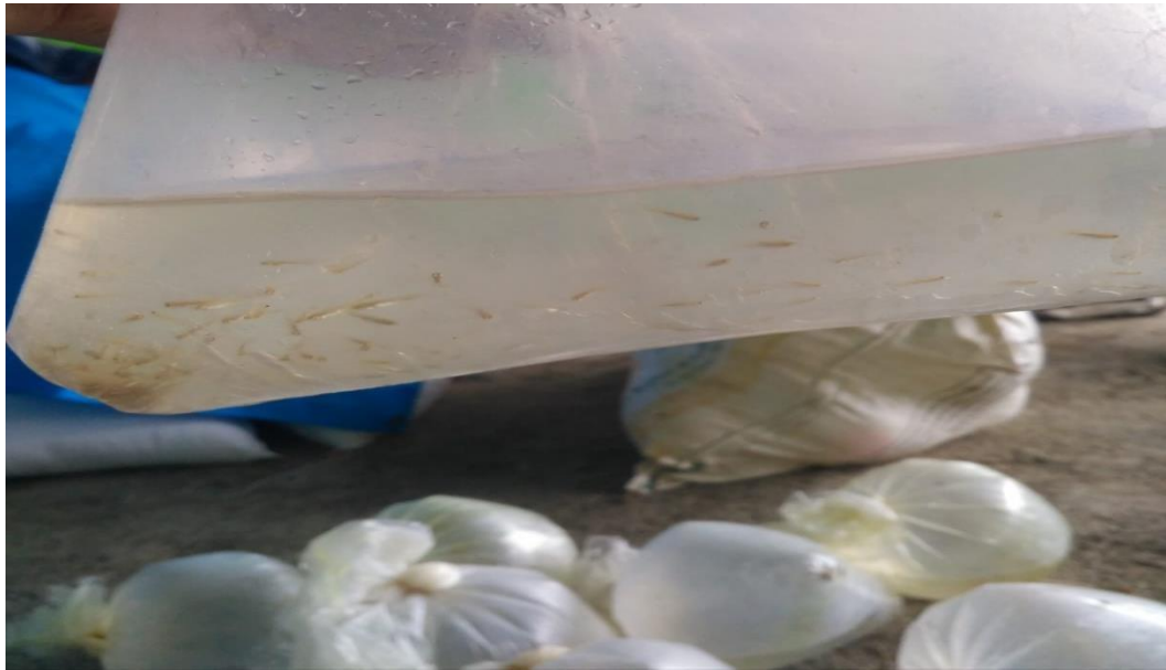
Gelondong Ikan Bandeng