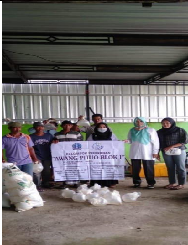
Wawancara Dengan Para Responden