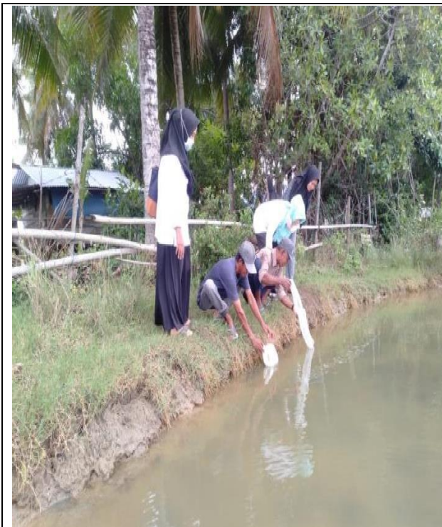
Kegiatan Penebaran Benih, Serta Wawancara Dengan Responden